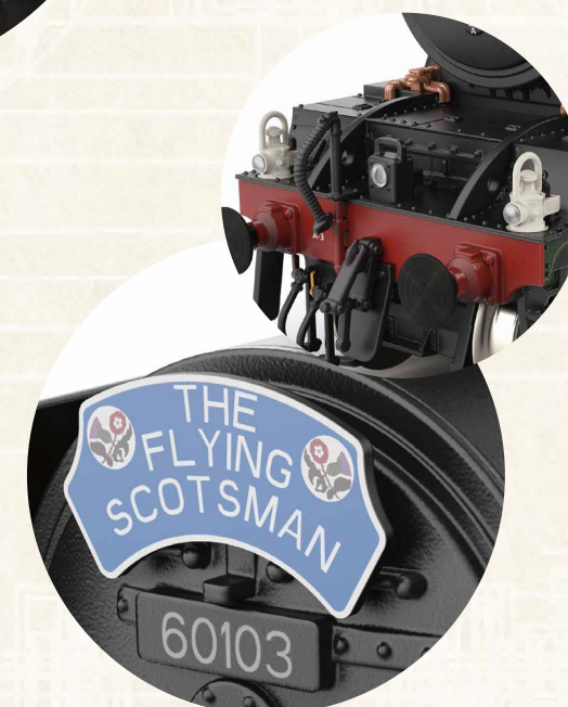
Abbildung zeigt erste Umsetzung als Rendering.

Hochdetailliert und sauberst umgesetzt zeigt sich ebenfalls die Front des Flying Scotsman mit Zugschild, Laternen und Kupferleitungen.