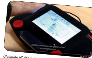
Gleisplan H0 Modellbahn erstellen – Anleitung Märklin CS3

Testen Sie unseren optimierten Märklin YouTube Kanal