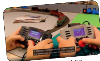
Anleitung 2 Mobile Station auf einer Anlage

Unter https://www.maerklin.de/de/service/kundenservice/erklavideos/