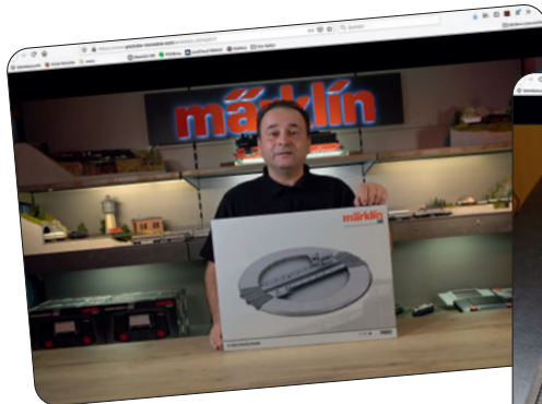
Märklin C-Gleis Drehscheibe

Viele hilfreiche Tipps und Erklärvideos jetzt jederzeit aufrufbar!