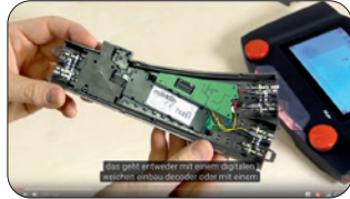
Märklin Anleitung – Weichen digital schalten mit der CS3

Unter https://www.maerklin.de/de/service/kundenservice/erklavideos/