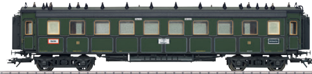
41359 Schnellzugwagen CCü € 69,99 *