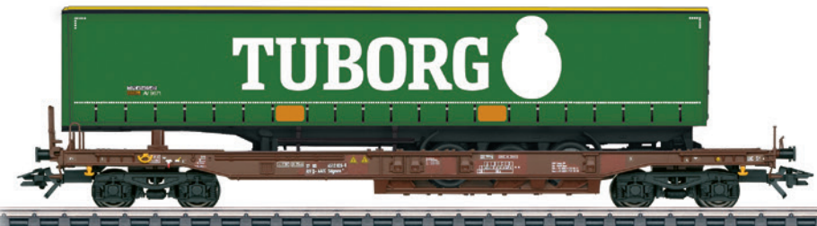
47113 Taschenwagen „Tuborg“