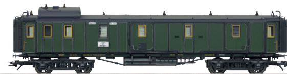
41379 Schnellzug-Gepäckwagen PPü € 69,99 *

Der passende Tauschradsatz zu diesen Schnellzugwagen ist der Gleichstromradsatz E32301211.