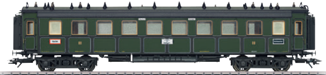
41358 Schnellzugwagen CCü € 69,99 *