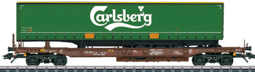
47112 Taschenwagen „Carlsberg“