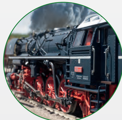
Geregelter Hochleistungsantrieb mit Schwungmasse im Kessel, vier Achsen angetrieben.

This model can be found in an AC version in the Märklin H0 assortment under item number 39498.