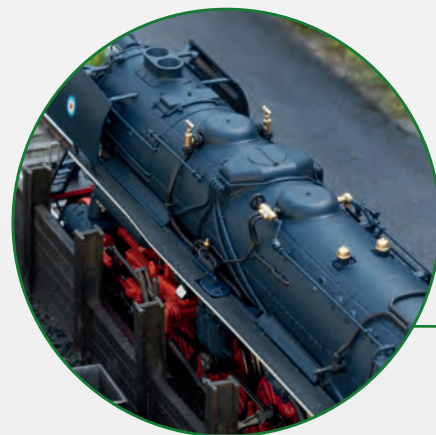
Filigrane Metallkonstruktion, viele Details angesetzt.

Controlled high-efficiency propulsion with a flywheel, mounted in the boiler, 4 axles powered.