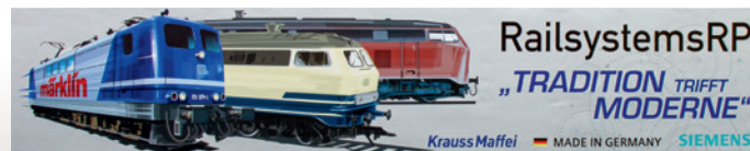
Mit aufwendiger Sondergestaltung zeigt sich die 248 002-8 der RailSystems RP GmbH (RP).