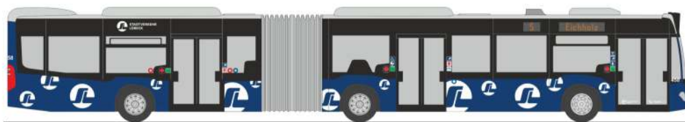
MERCEDES-BENZ Citaro G `15 „Stadtverkehr Lübeck“ 73600 | 1:87 | D | PG 49