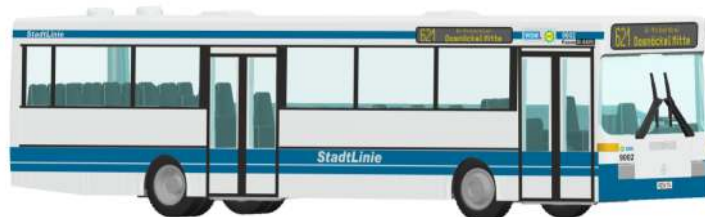
MERCEDES-BENZ O 405 „WSW mobil, Wuppertal“ 71830 | 1:87 | D | PG 45