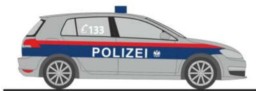
VOLKSWAGEN Golf 7 „Polizei“ 53201 | 1:87 | AT | PG 24