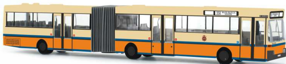
MERCEDES-BENZ O 405 G „NMVB“ 69818 | 1:87 | NL | PG 49