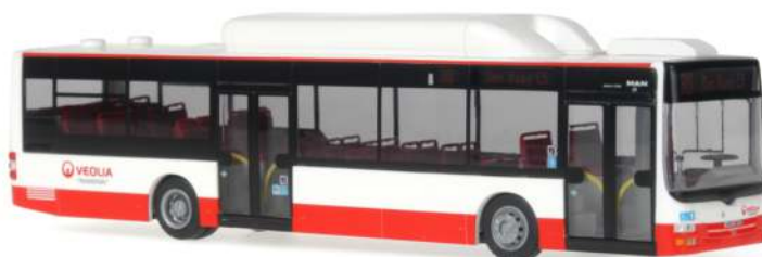
MAN Lion's City „Veolia“ 72704 | 1:87 | NL | PG 45