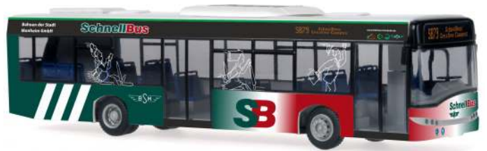
SOLARIS Urbino 12 „BSM - Schnellbus, Monheim“ 65964 | 1:87 | D | PG 45