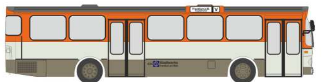
MERCEDES-BENZ O 305 „Stadtwerke Frankfurt“ 74303 | 1:87 | D | PG 49