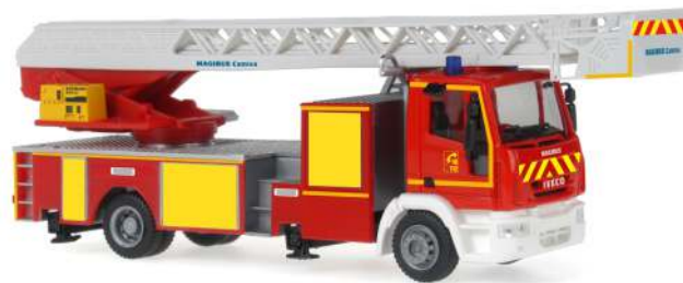
IVECO MAGIRUS DLK 32 „Fw18“ 68550 | 1:87 | F | PG 45