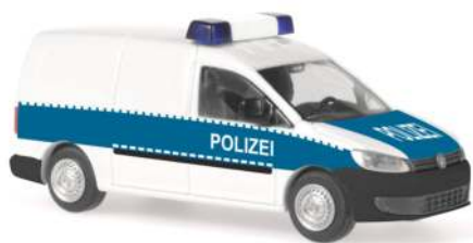
VOLKSWAGEN Caddy Maxi `11 „Polizei“ 52707 | 1:87 | D | PG 23