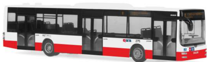
MAN Lion's City Euro 6 „SETA“ 72705 | 1:87 | IT | PG 45