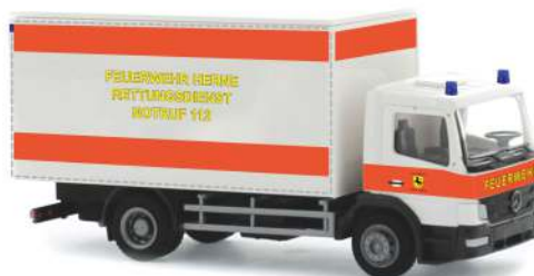
MERCEDES-BENZ Atego „Feuerwehr Herne - Rettungsdienst“ 72502 | 1:87 | D | PG 21