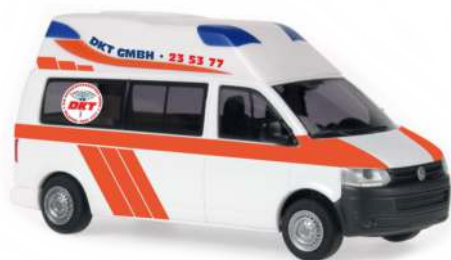
AMBULANZ MOBILE Hornis Silver „DKT Rettungswagen Hamburg“ 53604 | 1:87 | D | PG 24