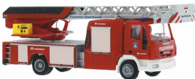
IVECO MAGIRUS DLK 32 „Feuerwehr Brandis“ 72605 | 1:87 | D | PG 45