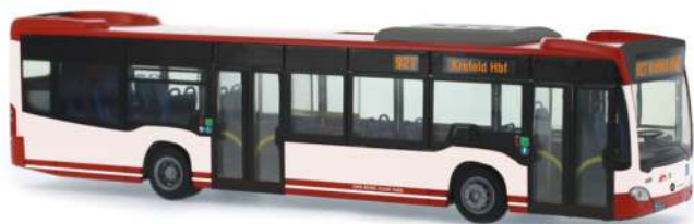
MERCEDES-BENZ Citaro `12 „Stadtwerke Krefeld“ 69468 | 1:87 | D | PG 45