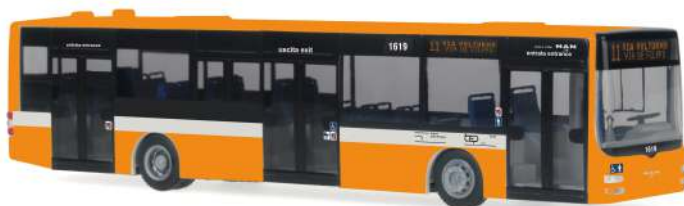
MAN Lion's City Euro 6 „TEP“ 72702 | 1:87 | IT | PG 45