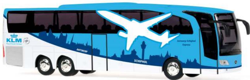
MERCEDES-BENZ Travego M Euro 6 „KLM“ 14124 | 1:43 | NL | PG 60