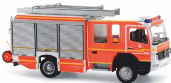
IVECO MAGIRUS LOHR HF „Feuerwehr Hamburg - Veddel“ 68920 | 1:87 | D | PG 43