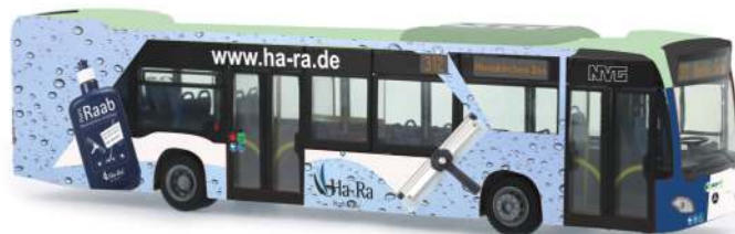
MERCEDES-BENZ Citaro `12 „Neunkircher Verkehrs GmbH“ 69469 | 1:87 | D | PG 45