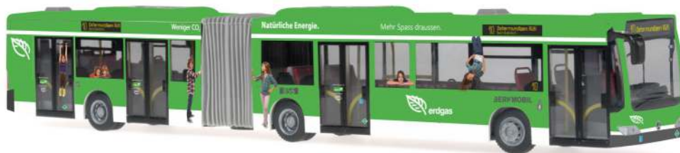
MERCEDES-BENZ Citaro G CNG `06 „Bernmobil“ 67088 | 1:87 | CH | PG 49