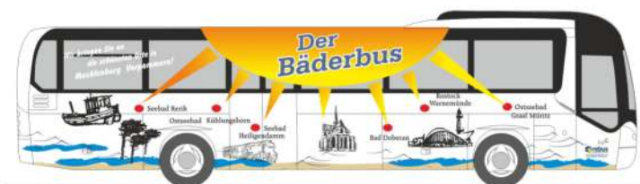
NEOPLAN Trendliner „Bäderbus, Rostock“ 65613 | 1:87 | D | PG 45