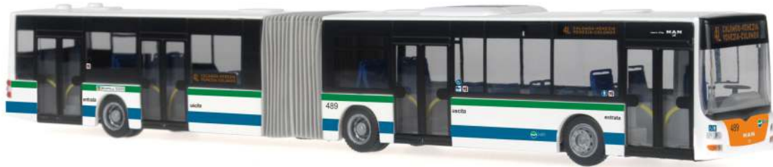
MAN Lion's City G CNG „ACTV Venezia“ 72750 | 1:87 | IT | PG 49