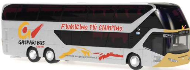
NEOPLAN Skyliner `11 „Gaspari Reisen“ 69027 | 1:87 | IT | PG 49