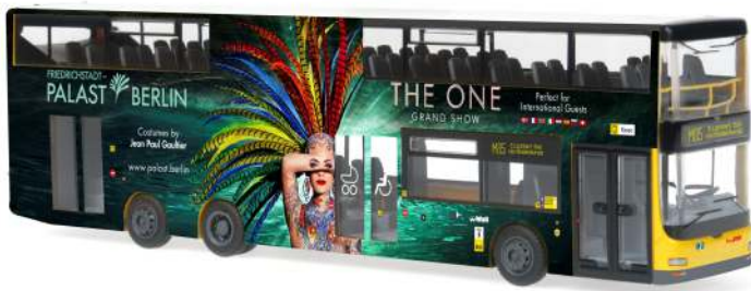
MAN Lion's City DL07 „BVG - Friedrichstadtpalast“ 67776 | 1:87 | D | PG 49