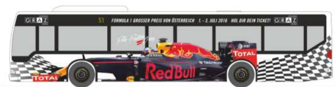
MERCEDES-BENZ Citaro „Graz Linien - Formula 1“ 66998 | 1:87 | AT | PG 45