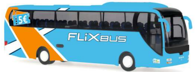
MAN Lion's Coach „FlixBus“ 65542 | 1:87 | D | PG 45