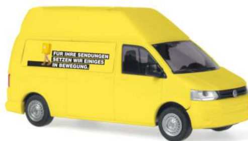
VOLKSWAGEN T5 GP „Post.at“ 31619 | 1:87 | AT | PG 23