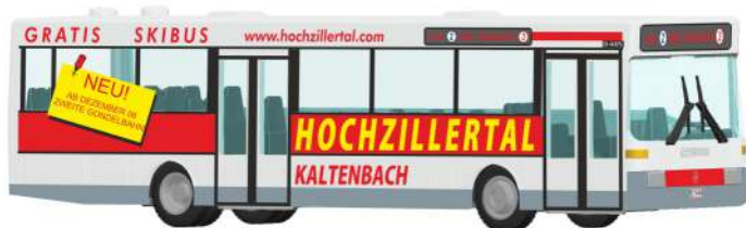
MERCEDES-BENZ O 405 „Hochzillertal“ 71817 | 1:87 | AT | PG 45