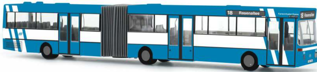
MERCEDES-BENZ O 405 G „KVG Kassel“ 69828 | 1:87 | D | PG 49