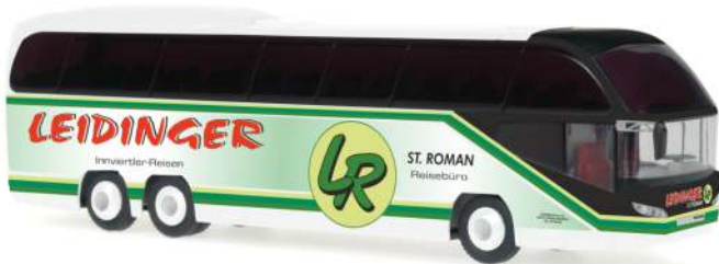
NEOPLAN Cityliner C „Leidinger Reisen“ 63991 | 1:87 | AT | PG 45