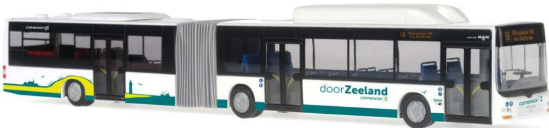
MAN Lion's City G „Connexion Zeeland“ 72751 | 1:87 | NL | PG 49