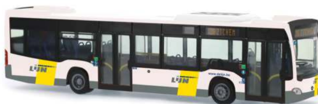
MERCEDES-BENZ Citaro `12 „De Lijn“ 69466 | 1:87 | B | PG 45