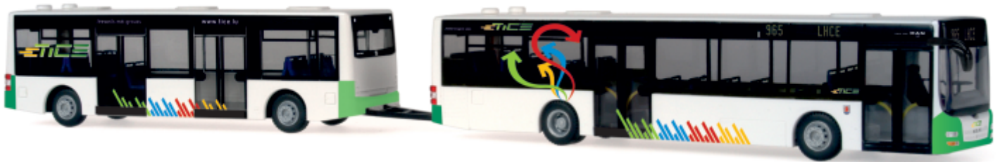
GÖPPEL Maxi Train „TICE“ 66017 | 1:87 | LU | PG 53