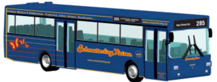
MAN SL 202 „Schmetterling Reisen“ 72108 | 1:87 | D | PG 45