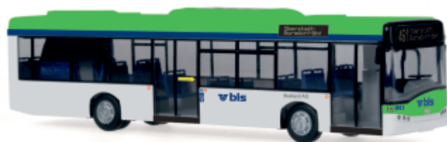
SOLARIS Urbino 12 „BLS“ 65954 | 1:87 | CH | PG 46