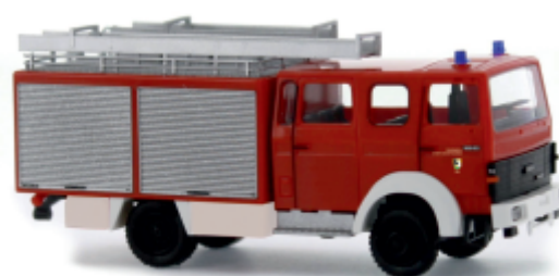
IVECO MAGIRUS MK LF 16 „Feuerwehr Schaffhausen“ 71017 | 1:87 | CH | PG 41