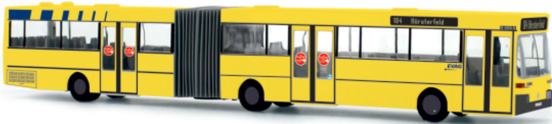
MERCEDES-BENZ O 405 G „EVAG, Essen“ 69821 | 1:87 | D | PG 50