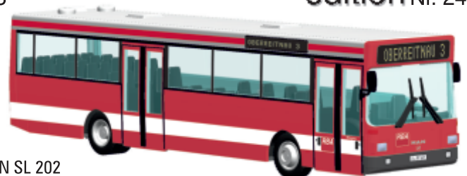
MAN SL 202 „RBA, Augsburg“ 72111 | 1:87 | D | PG 44