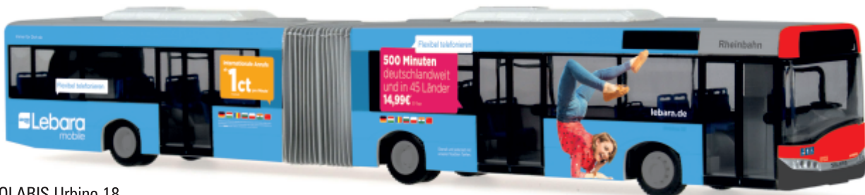
SOLARIS Urbino 18 „Rheinbahn - lebara mobile“ 66857 | 1:87 | D | PG 49