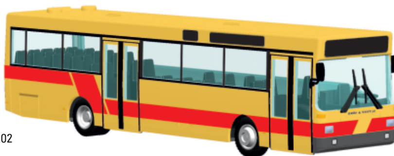
GRÄF & STIFT SL 202 „ÖBB, Wien“ 72112 | 1:87 | AT | PG 45