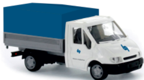
FORD Transit „Wiener Lokalbahn“ 31137 | 1:87 | AT | PG 22