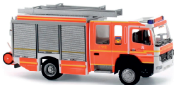
IVECO MAGIRUS LOHR Alufire 3 „Feuerwehr Hamburg - Bergedorf“ 68918 | 1:87 | D | PG 43