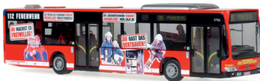
MERCEDES-BENZ Citaro `06 „PVG-VHH - Landesfeuerwehrverband Schleswig-Holstein“ 14235 | 1:43 | D | PG 60