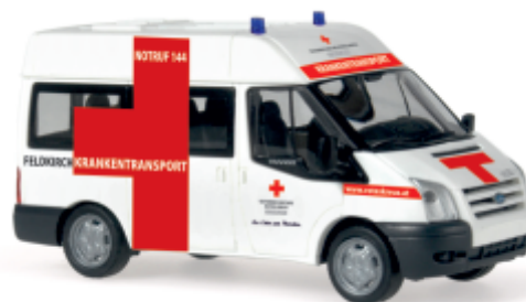
FORD Transit „ÖRK - Feldkirch“ 51590 | 1:87 | AT | PG 23