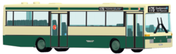
MERCEDES-BENZ O 405 „infra, Fürth“ 71810 | 1:87 | D | PG 44