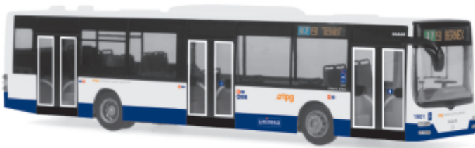
MAN Lion's City „TPG Globe“ 67483 | 1:87 | CH | PG 46