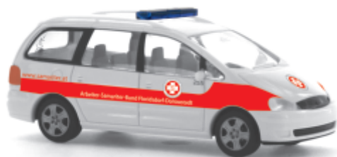
FORD Galaxy „ASB Florisdorf“ 51099 | 1:87 | AT | PG 23