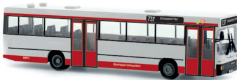
NEOPLAN N 416 „Rheinbahn, Düsseldorf“ 71701 | 1:87 | D | PG 44