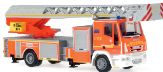
IVECO MAGIRUS DLK 32 „Feuerwehr Hamburg - Bergedorf“ 68549 | 1:87 | D | PG 45