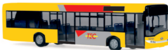
SOLARIS Urbino 12 „TEC“ 65955 | 1:87 | B | PG 45