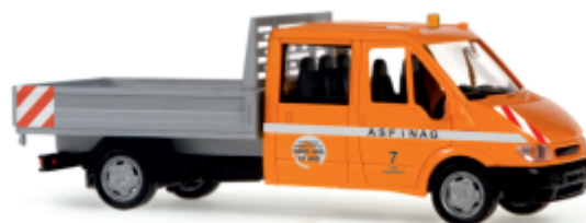
FORD Transit „Asfinag“ 31138 | 1:87 | AT | PG 22