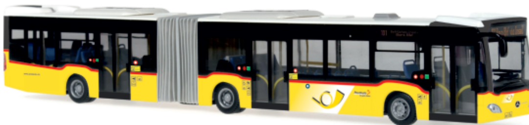
MERCEDES-BENZ Citaro G Euro 6 „Die Post“ 69519 | 1:87 | CH | PG 49