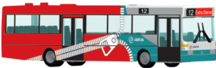
MERCEDES-BENZ O 405 „Arriva“ 71812 | 1:87 | NL | PG 45