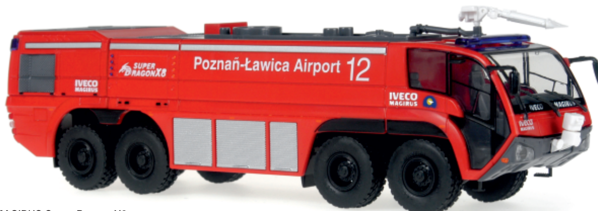
IVECO MAGIRUS Super Dragon X8 „Poznan Lawica“ 14402 | 1:43 | PL | PG 71