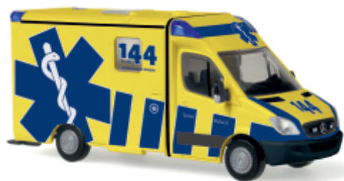
SYSTEM STROBEL RTW „Spital Bülach“ 61780 | 1:87 | CH | PG 28