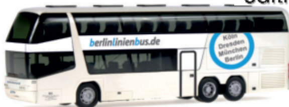
NEOPLAN Skyliner `03 „BerlinLinienBus“ 65328 | 1:87 | D | PG 45