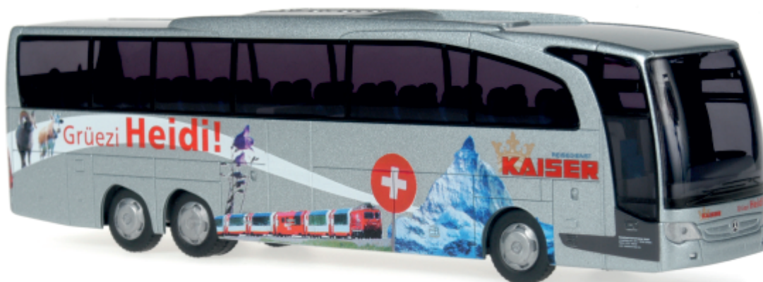
MERCEDES-BENZ Travego M „Reisedienst Kaiser, Zwickau“ 14118 | 1:43 | D | PG 60