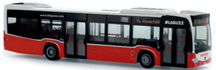
MERCEDES-BENZ Citaro Euro 6 „Blaguss“ 69435 | 1:87 | AT | PG 46