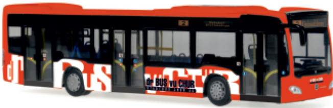
MERCEDES-BENZ Citaro Euro 6 „Stadtbus Chur“ 69437 | 1:87 | CH | PG 46