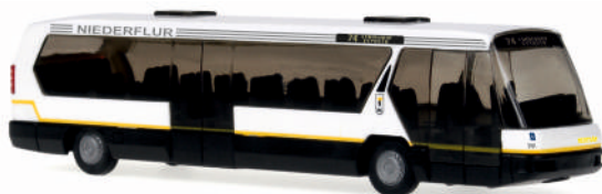
NEOPLAN Metroliner „BVG, Berlin“ 60149 | 1:87 | D | PG 27