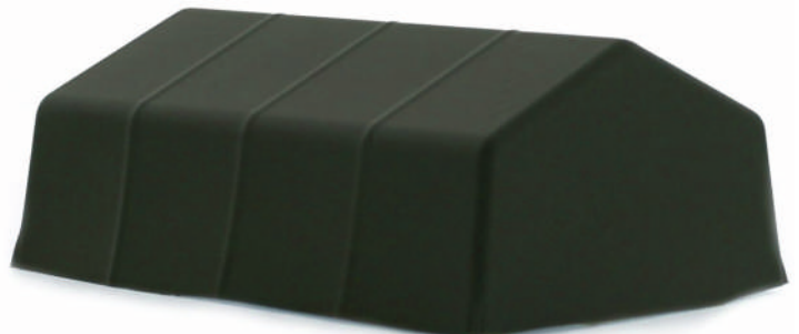
Militärzelt 65 x 95 mm 70285 | 1:87 | PG 5