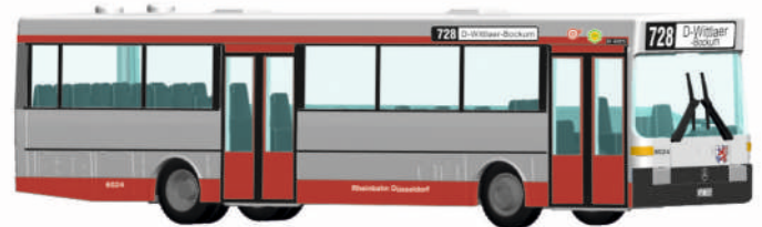
MERCEDES-BENZ O 405 „Rheinbahn, Düsseldorf“ 71808 | 1:87 | D | PG 44