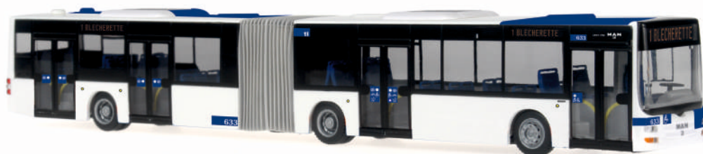
MAN Lion's City G „TL Lausanne“ 67292 | 1:87 | CH | PG 50