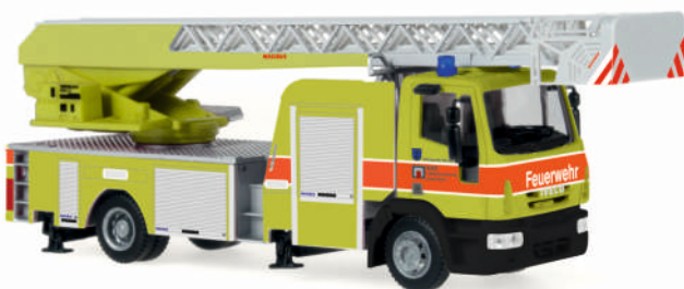
MAGIRUS DLK 32 „Feuerwehr Dietikon“ 68548 | 1:87 | CH | PG 45