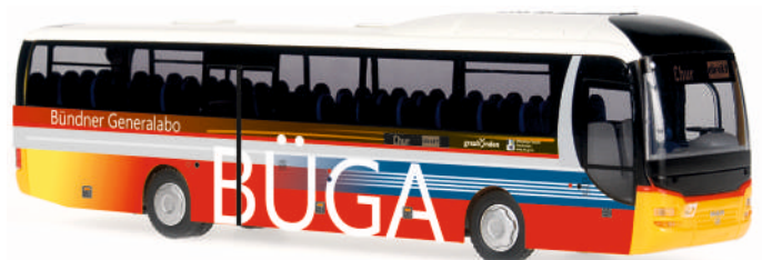
MAN Lion's Regio „Die Post - Büga“ 65840 | 1:87 | CH | PG 45