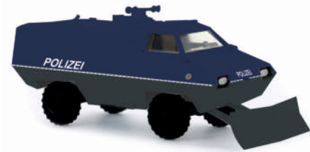
THYSSEN TM 170 - SW 4 „Bundespolizei - blau/grau“ 67863 | 1:87 | D | PG43