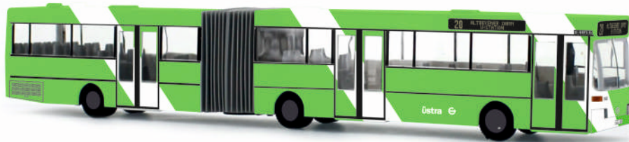
MERCEDES-BENZ O 405 G „üstra, Hannover“ 69817 | 1:87 | D | PG 49