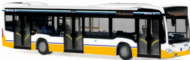
MERCEDES-BENZ Citaro Euro 6 „HEAG“ 69429 | 1:87 | D | PG 46