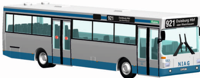
MAN SL 202 „NIAG, Moers“ 72109 | 1:87 | FN | D | PG 44