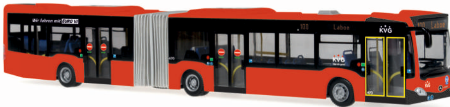
MERCEDES-BENZ Citaro G Euro 6 „KVG Kiel“ 69522 | 1:87 | D | PG 50