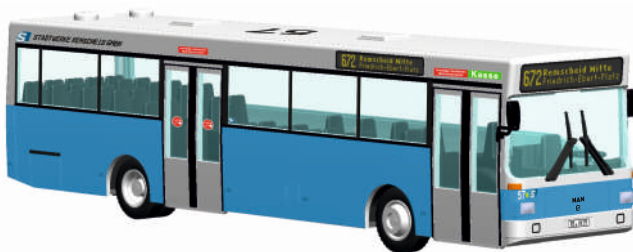
MAN SL 202 „Bücherbus Düsseldorf“ 72101 | 1:87 | FN | D | PG 44