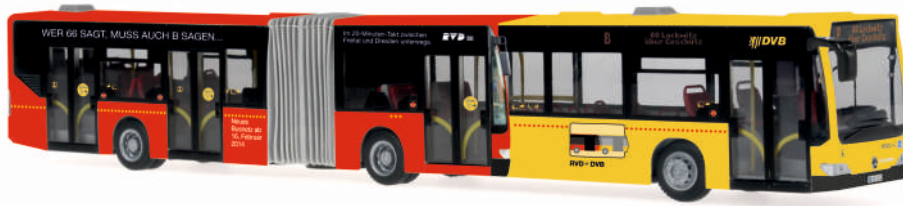
MERCEDES-BENZ Citaro G `06 „DVB, Dresden“ 67074 | 1:87 | D | PG 50