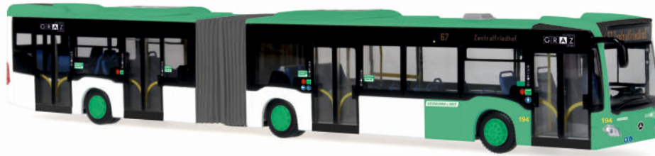
MERCEDES-BENZ Citaro G Euro 6 „Grazer Linien“ 69520 | 1:87 | AT | PG 50