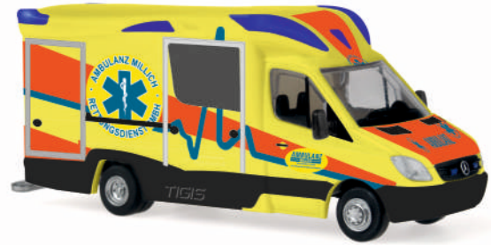
AMBULANZ MOBILE Tigis Ergo „Ambulanz Millich“ 68622 | 1:87 | D | PG 28