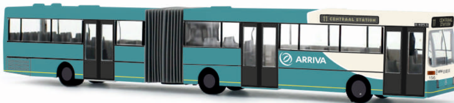
MERCEDES-BENZ O 405 G „Arriva“ 69819 | 1:87 | NL | PG 50