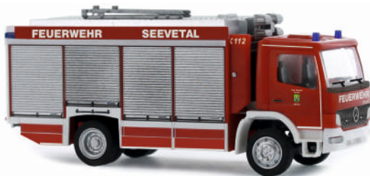
MAGIRUS Alufire 3 RW Atego „Feuerwehr Seevetal“ 71405 | 1:87 | D | PG 43