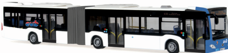
MERCEDES-BENZ Citaro G Euro 6 „EVZ, Zeven“ 69523 | 1:87 | D | PG 50