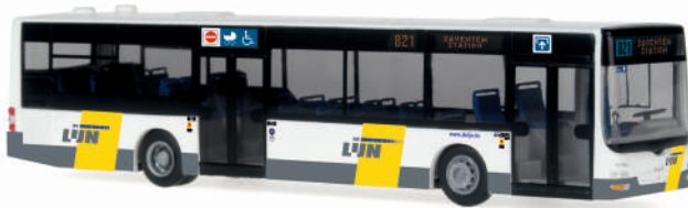
MAN Lion's City „De Lijn“ 67482 | 1:87 | B | PG 46