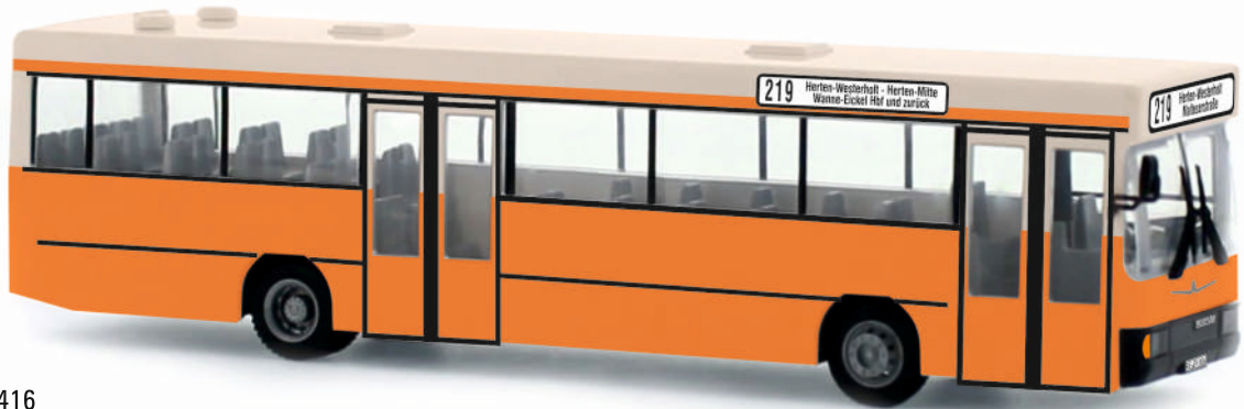
NEOPLAN N 416 „Vestische Straßenbahnen, Herten“ 71703 | 1:87 | FN | D | PG 44