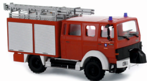
IMAGIRUS MK LF 8 „Feuerwehr Haltern“ 71306 | 1:87 | D | PG 41