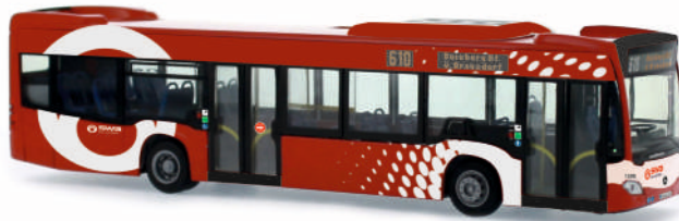
MERCEDES-BENZ Citaro Euro 6 „Stadtwerke Bonn“ 69428 | 1:87 | D | PG 46