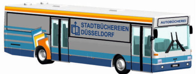
MAN SL 202 „Stadtwerke Remscheid“ 72102 | 1:87 | FN | D | PG 44