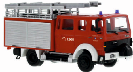
LENTNER LF 16-TS „Feuerwehr Monheim“ 71211 | 1:87 | D | PG 41