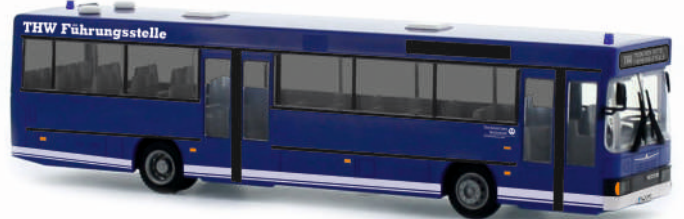
NEOPLAN N 416 „THW München-Mitte“ 71700 | 1:87 | FN | D | BOX | PG 45