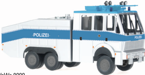
WaWe 9000 „Bundespolizei - weiß“ 67818 | 1:87 | D | PG 43