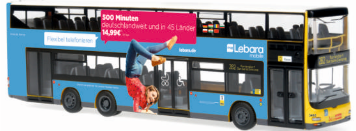
MAN Lion's City DL07 „BVG - lebara mobile“ 67765 | 1:87 | D | PG 49