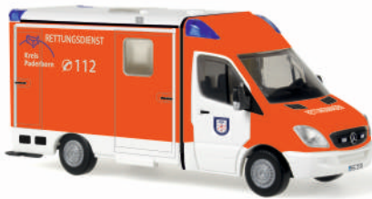
SYSTEM STROBEL RTW „Feuerwehr Paderborn“ 61651 | 1:87 | BV | D | BOX | PG 37