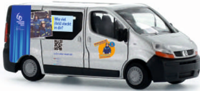
RENAULT Trafic „THW Moers“ 51382 | 1:87 | D | PG 23