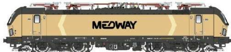
PI90012DC – PI90012DCS – PI90012ACS

Vectron 193 MEDWAY, giallo sabbia/giallo avorio ep.IV