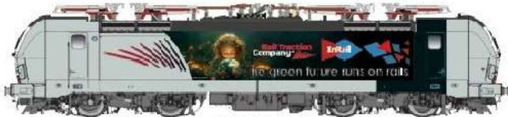
PI90010DC – PI90010DCS – PI90010ACS