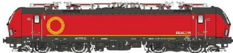
PI90013DC – PI90013DCS – PI90013ACS

Scritta MEDWAY grigia sul frontale – attualmente utilizzata in centro Europa, prossimamente in Italia