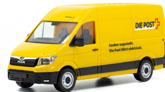
MAN eTGE Elektro-Lieferwagen