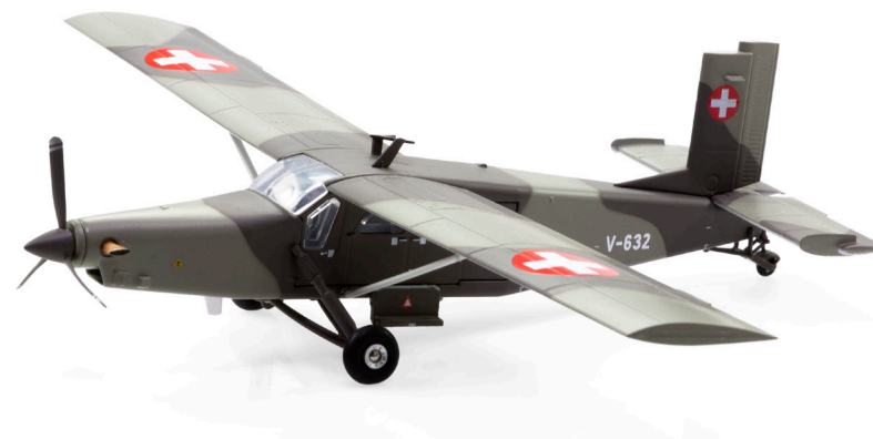
Pilatus PC-6 Turbo Porter V-632