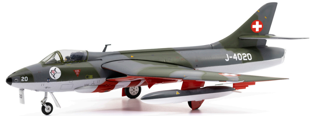
Hawker Hunter Mk.58 J-4020 Patrouille Suisse