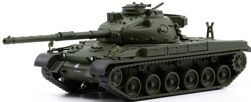
Kampfpanzer Pz 68