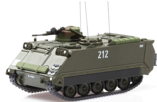
M113 Schützenpanzer 73 K-Nr. 212