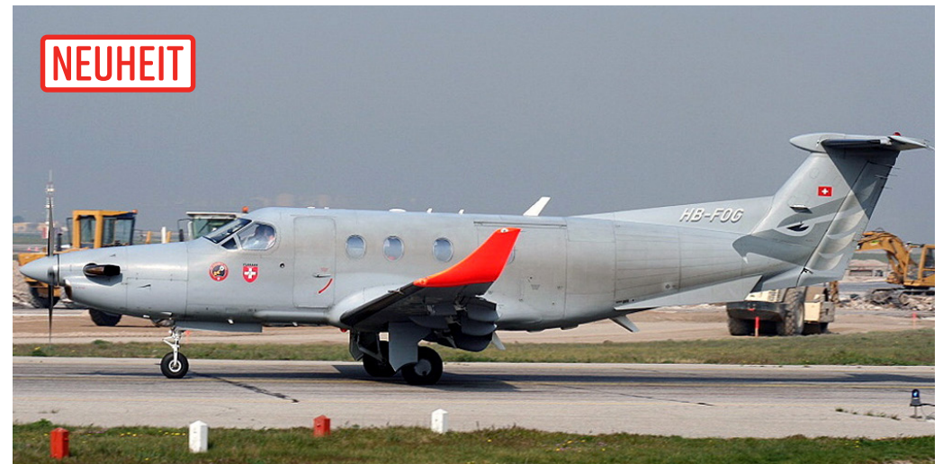
Pilatus PC-12 HB-FQG