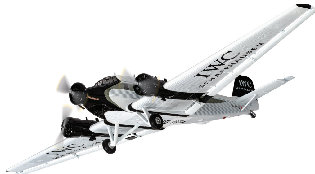
Junkers Ju 52/3 HB-HOS IWC

Unser Modell zeigt die HB-HOS in der letzten IWC Bemalungsvariante, so wie sie bis zu der zurzeit stattfindenden Revision im Einsatz war.