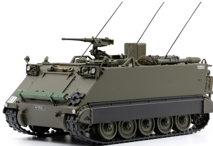
M113 Kommandopanzer 63