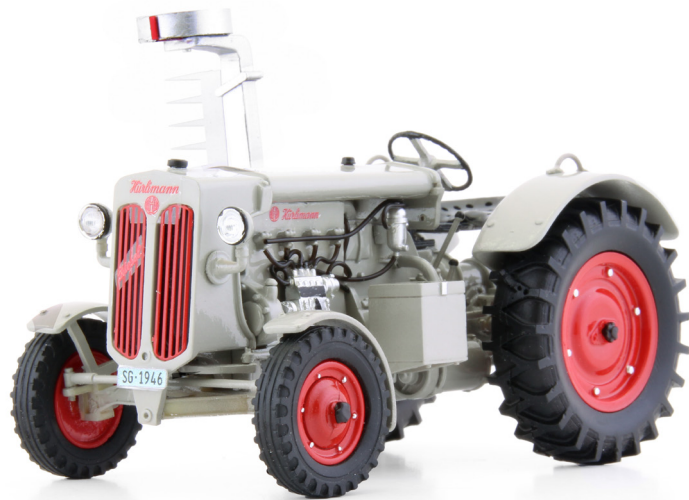
Hürlimann D-200 4x2 mit Motoregge (1948)