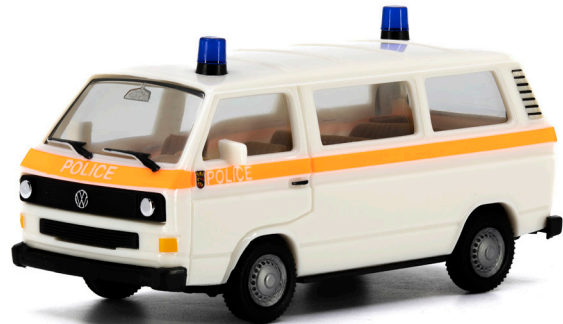
WV T3 Polizeibus Kantonspolizei Bern