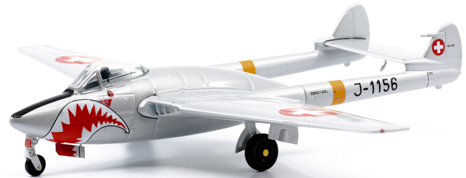
De Havilland D.H. 100 Mk.6 Vampire J-1156 «Sharkmouth» (1984)

Einer der grössten Schritte in der Aviatik wurde durch den Einsatz von Strahlflugzeugen vollzogen. Steigfähigkeit, Schallgeschwindigkeit, Reichweiten wie nie zuvor; das waren Kriterien von denen auch die Militärs in allen Ländern profitieren wollten. Selbst in der Schweiz plante man den Bau von eigenen Kampfjets.