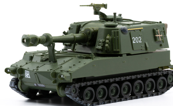
Panzerhaubitze M-109 Jg 66 Kurzrohr K-Nr. 202