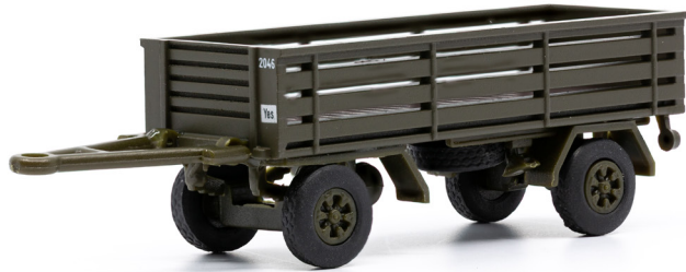
SIG Infanterie-Anhänger offen (1973)