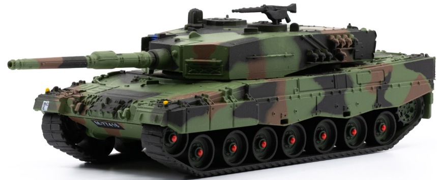
Pz 87 Leopard WE ohne Schalldämpfer