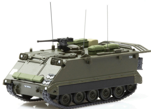
M113 Feuerleitpanzer 63