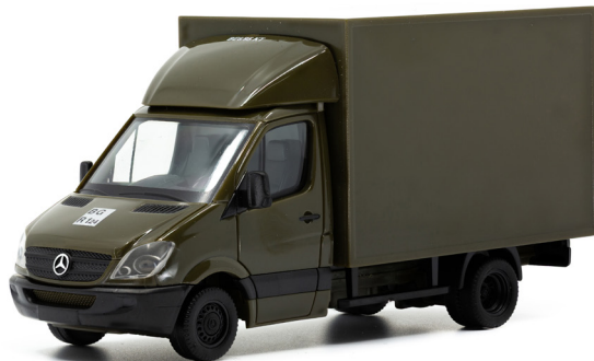
MB Sprinter 516 Cdi 4x4 Kastenaufbau Erstw 1 BE6/95 KT