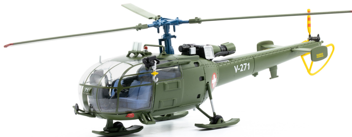
Alouette III V-271

Am 10. Dezember 2010, wurde die Alouette III auf dem Militärflugplatz Alpnach im Rahmen einer kleinen Feier noch einmal gewürdigt. Dabei kam es zu einem letzten Formationsflug mit Schweizer Alouette III. Die verbleibenden Helikopter wurden der National Disaster Management Authority in Pakistan übergeben, wo sie bei der Bewältigung von Naturkatastrophen eingesetzt werden. In der Schweizer Luftwaffe wurden die Alouette III durch 20 mit dem Rüstungsprogramm 2005 beschafften Helikopter vom Typ Eurocopter EC635 ersetzt.