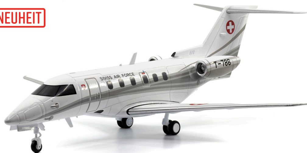
Pilatus PC-24 T-786 Bundesrat-Jet