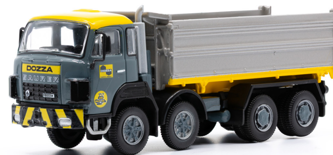
Saurer D330B F8x4 Kipper