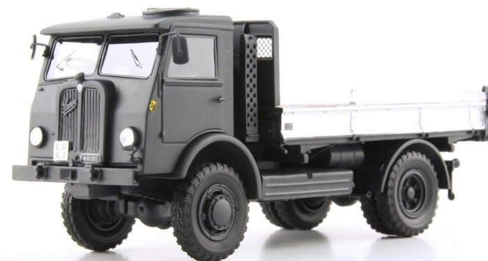
Saurer 5 CM 5.0t 4x4 «Vierlivier» Kipper