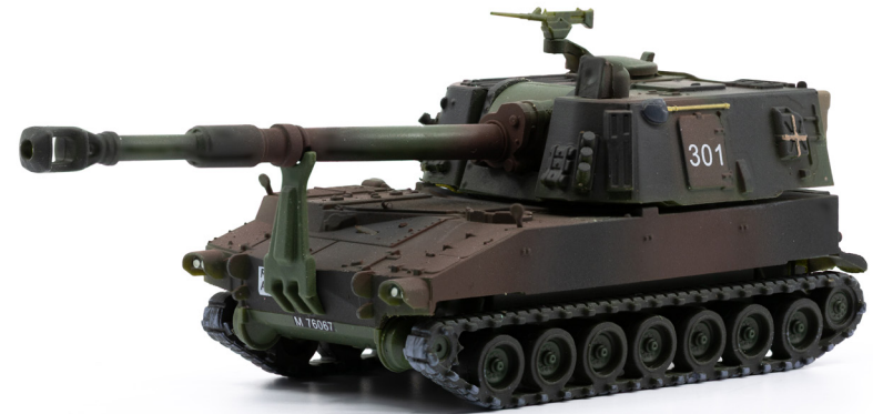
Panzerhaubitze M-109 Jg 79 Langrohr K-Nr. 301 Tarnmuster