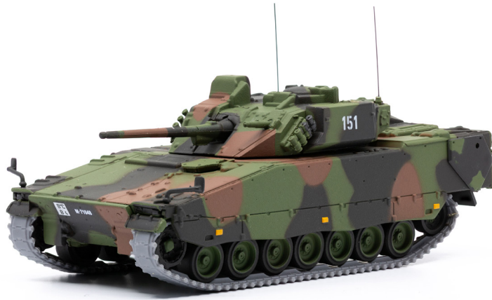
Spz 2000 CV9030 MkII Hägglunds K-Nr. 151