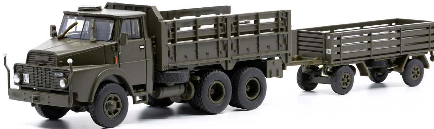
Henschel HS 3-14 HA CH 8,2 t gl 6x6 mit Infanterie-Anhänger offen