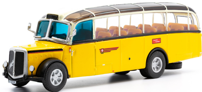
Berna L4U Alpenwagen IIIa