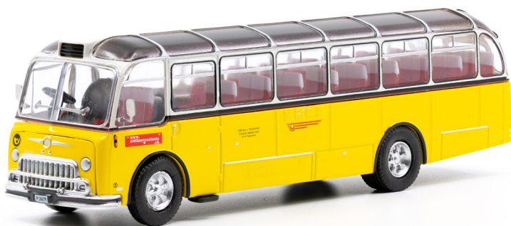
FBW C40U-Alpenwagen «Haifisch»