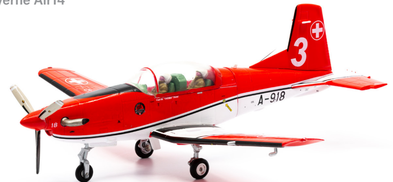
Pilatus PC-7 A-918 PC-7 TEAM Nr. 3