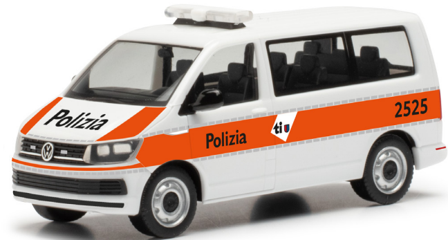
85.005111 VW T6 Transporter Kantonspolizei Tessin