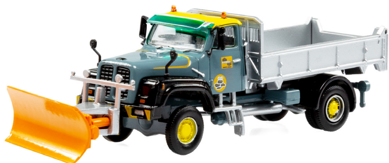
Saurer D330B N4x4 Kipper mit Schneeräumer