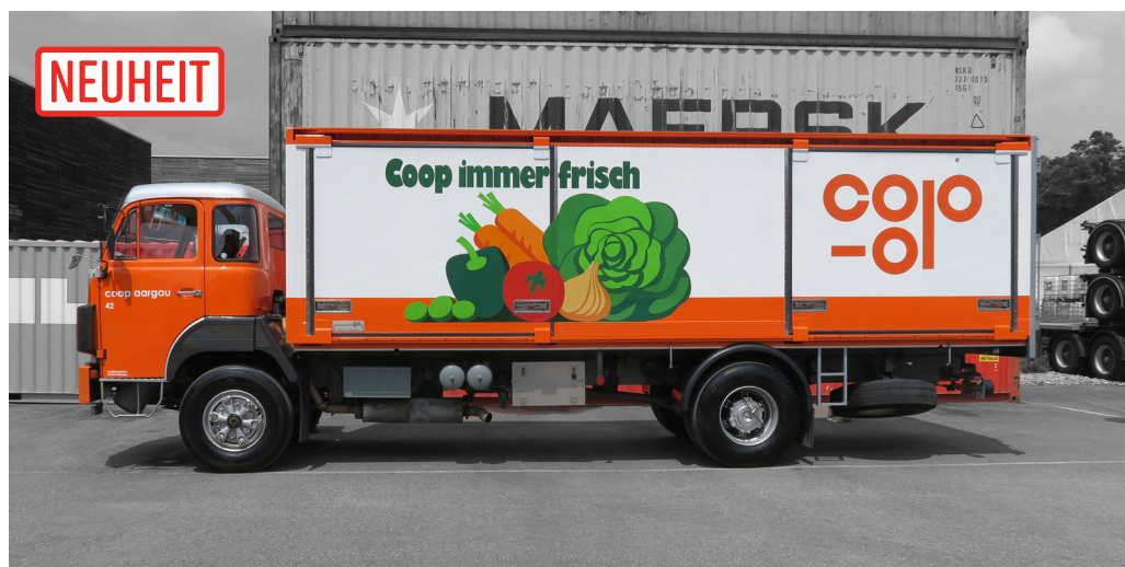
Berna D290B F4x2 Frigo