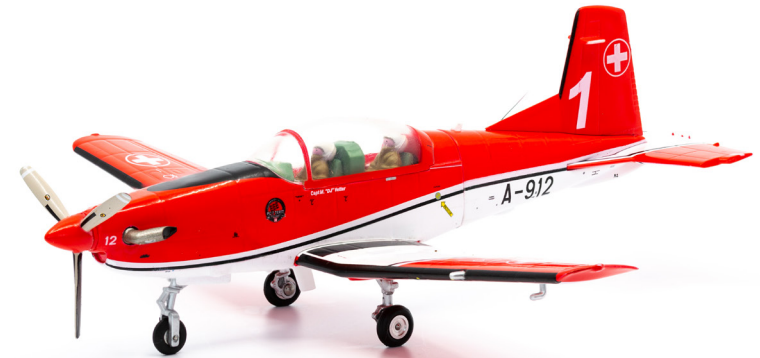
Pilatus PC-7 A-912 PC-7 TEAM Nr. 1