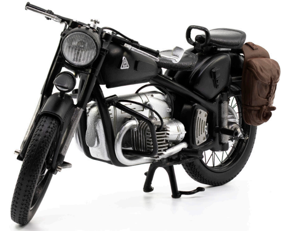
Condor A 580-1 (1951)