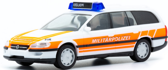
Opel Omega B 2,5 V6i Militärpolizei