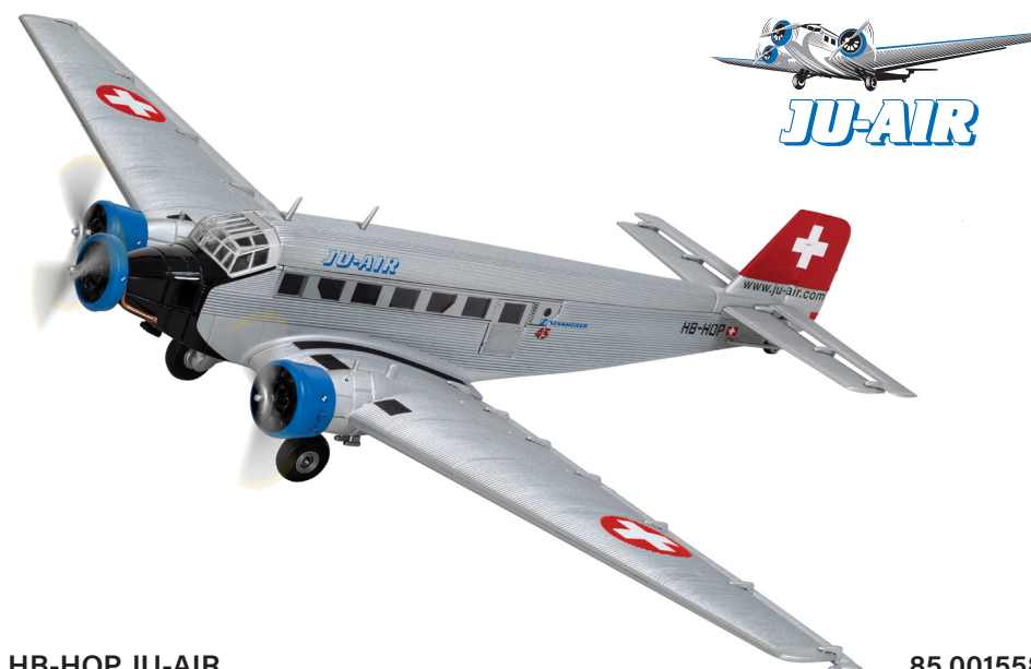
Junkers Ju 52/3 HB-HOP JU-AIR