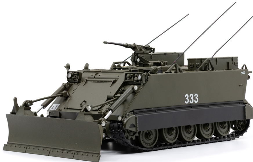
M113 Geniepanzer 63