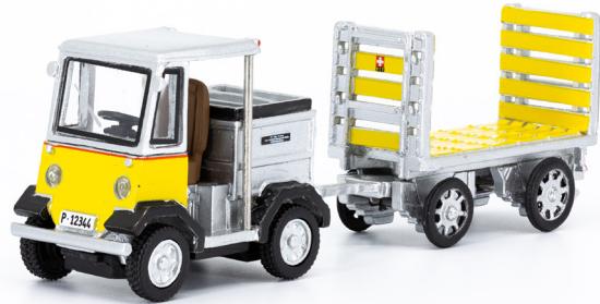
NEFAG Elektro-Schlepper mit Anhänger