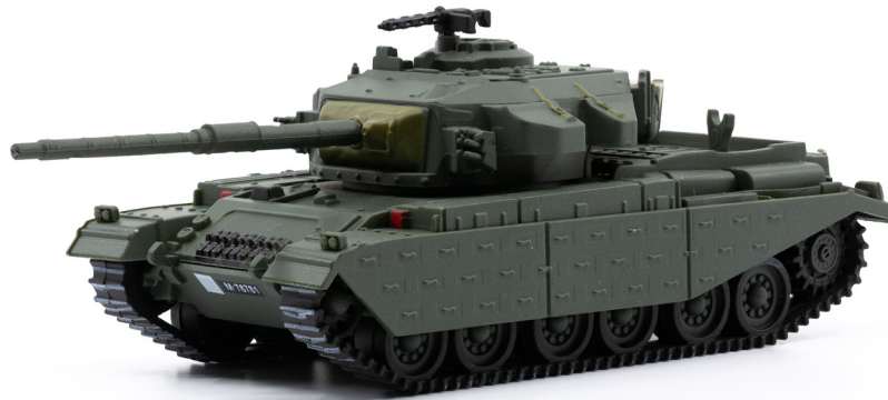
Pz 57/60 Centurion 10,5 cm Rohr