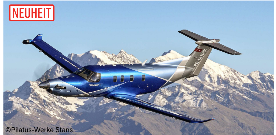
Pilatus PC-12 NGX HB-FQI

Im Oktober 2019 hat Pilatus dann die neueste Version, den PC-12 NGX in Las Vegas vorgestellt. Er verfügt über ein elektronisches Propeller- und Motorsteuerungssystem. Ausserdem erhöht das neue Triebwerk die maximale Reisegeschwindigkeit auf 537 Kilometer pro Stunde und die Kabinenfenster wurden um rund 10 Prozent vergrössert.