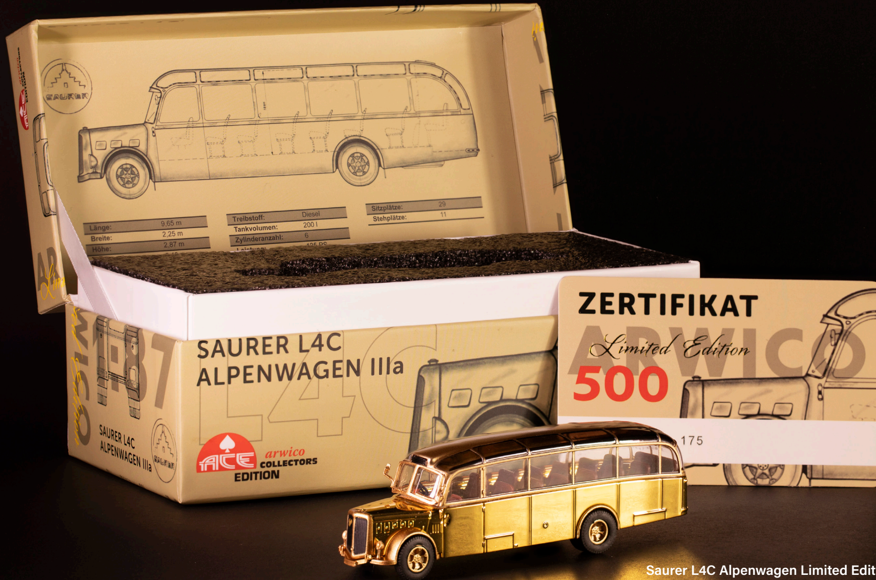
Saurer L4C Alpenwagen Limited Edition Gold 85.002009