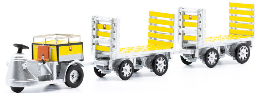
NEFAG Elektro-Schlepper 3-Rad mit zwei Anhänger