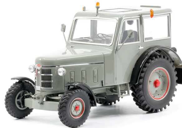
Bührer FFD6 Industrietraktor