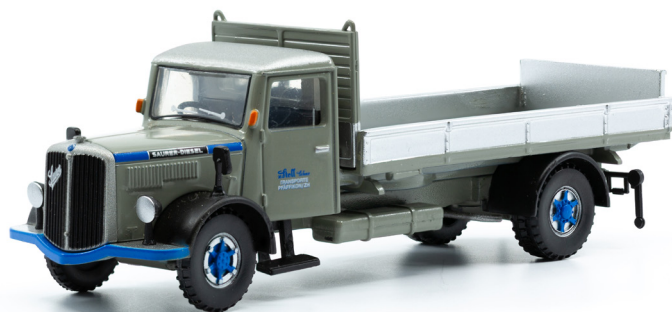
Saurer S4C Kipper (1956)