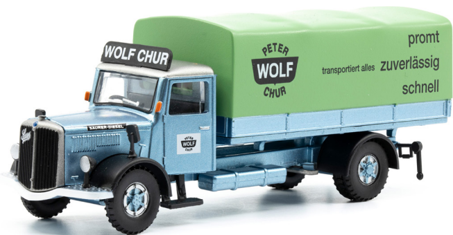
Saurer S4C Pritsche-Plane