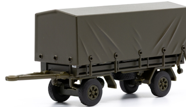
SIG Infanterie-Anhänger mit Plane (1973)