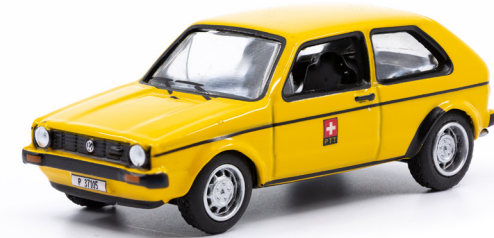
VW Golf 1

Leider ereilte alle dasselbe Schicksal im Laufe der 1980er Jahre und eine Schliessung dieser traditionsvollen Unternehmen war unumgänglich.