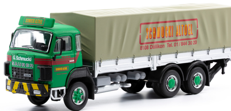
Saurer D290B F6x2 Pritsche-Plane