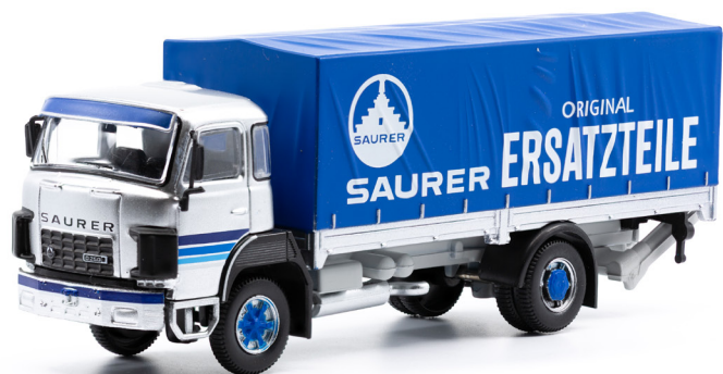
Saurer D250B F4x2 Pritsche-Plane