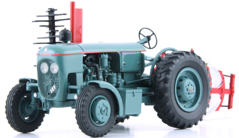
Vevey 560 mit Pflug und Motoregge