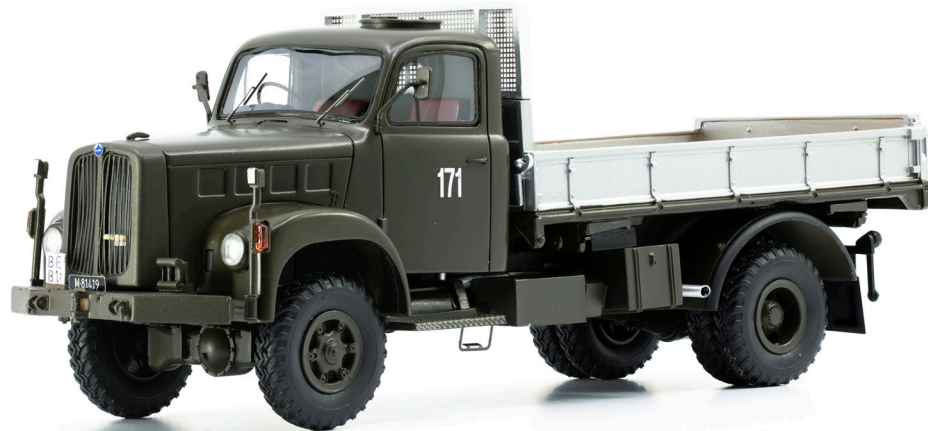
Saurer 2DM 4x4 Kipper