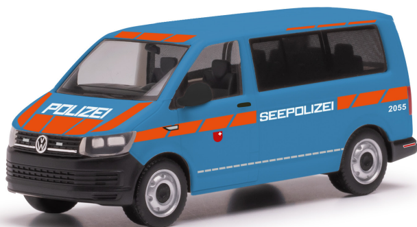
VW T6 Transporter Seepolizei Schwyz