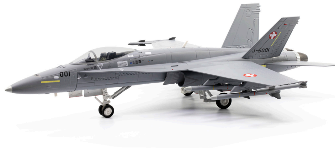
F/A-18C Hornet J-5001