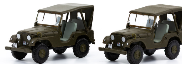
Set mit zwei Willys Jeep M38A1