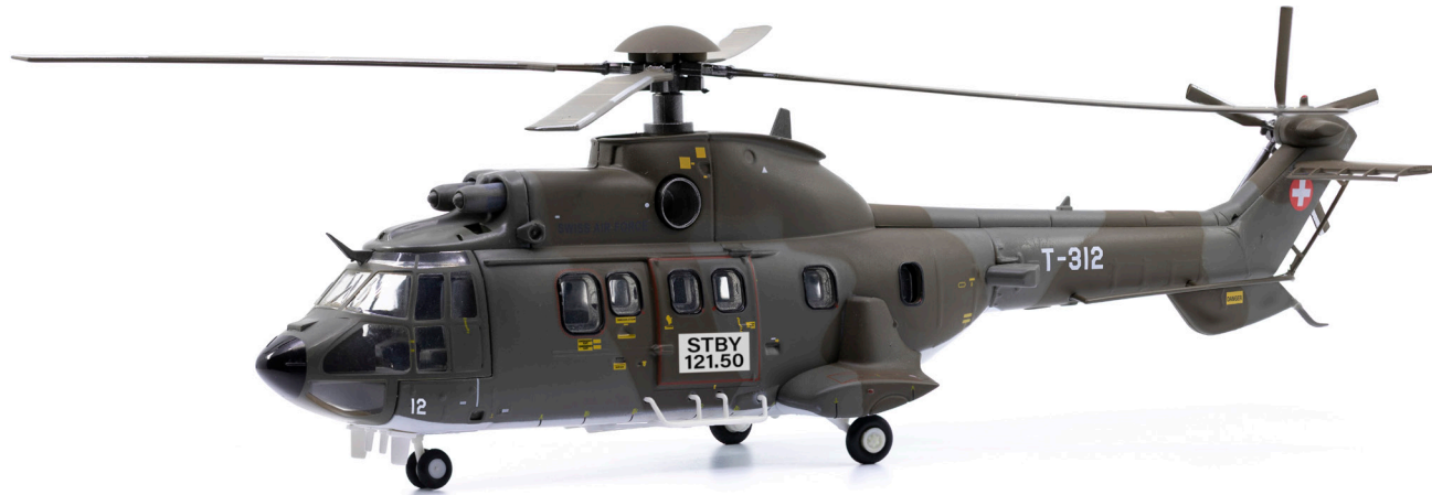
Cougar AS532 T-312 Luftraumüberwachung