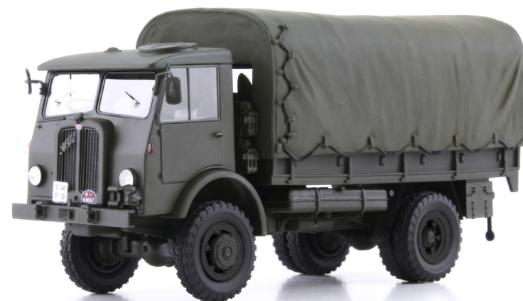
FBW AX40 5.0t 4x4 «Vierlivier» Blachenwagen