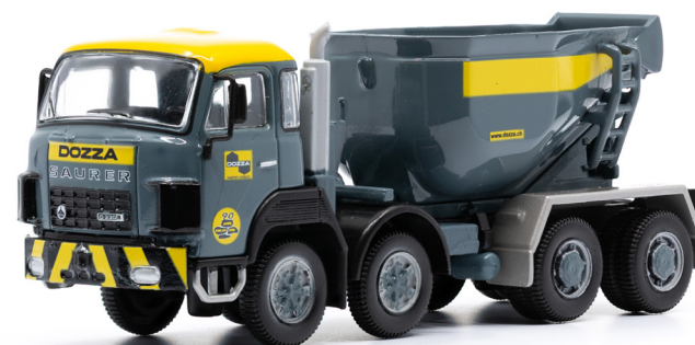
Saurer D330B F8x4 Betonmulde