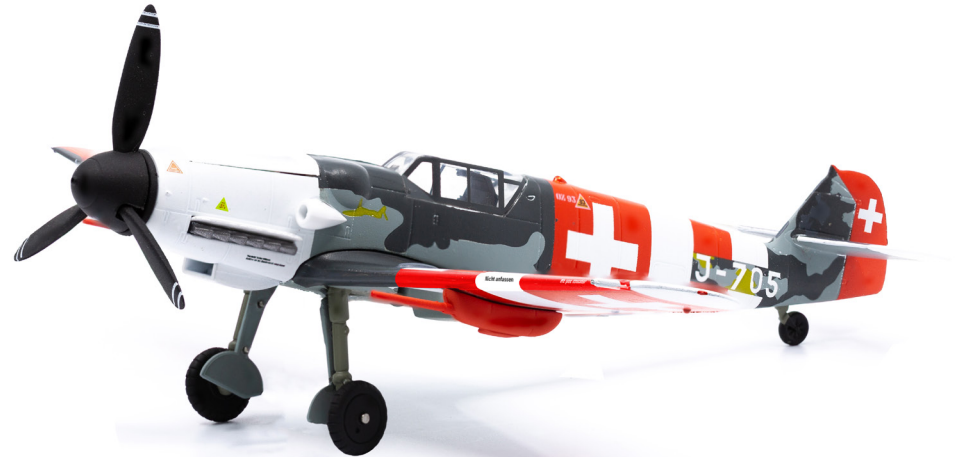
Messerschmitt Me 109 G-6 J-705 (1945)