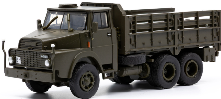
Henschel HS 3-14 HA CH 8,2 t gl 6x6 offene Ladefläche