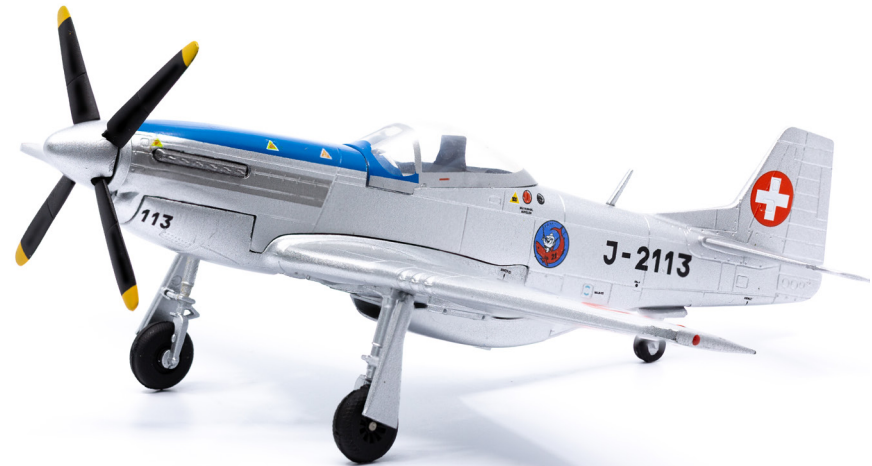
North American P-51 D Mustang J-2113 (1948)