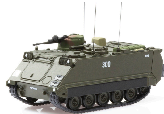
M113 Kommandopanzer 73 K-Nr. 300