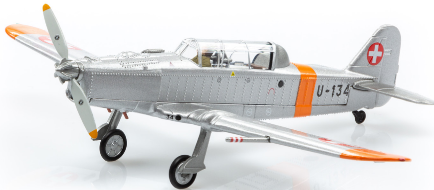
Pilatus P-2-06 U-134 (1970)