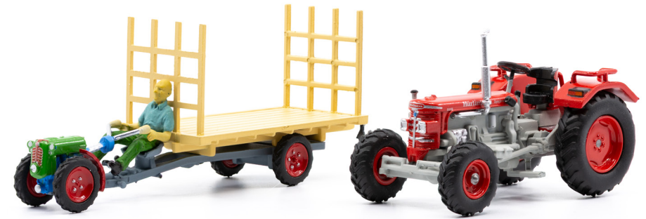
Set mit Hürlimann D210 und Rapid Special mit Anhänger inkl. Figur

Zwei Ikonen aus der Mechanisierung der Schweizer Landwirtschaft. Was mit Beginn der Wirtschaftswunderzeit und den folgenden Jahrzehnten alles an Fahrzeugen entstand, war einfach grossartig. Dank Erfindergeist, Pragmatismus und einem ausgesprochenen Empfinden für Qualität gingen Erzeugnisse hervor, die das Bild entlang der Bahnlinien in der ganzen Schweiz über Jahrzehnte prägten.