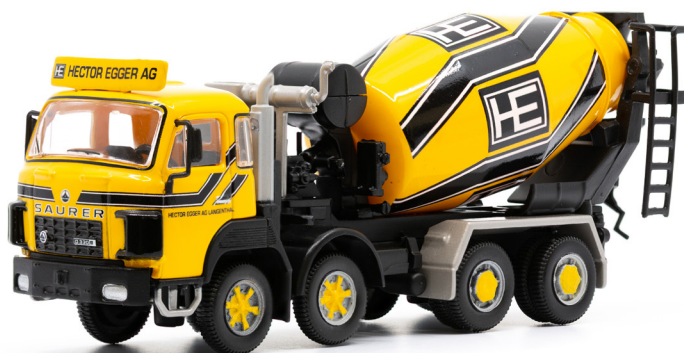
Saurer D330B F8x4 Betonmischer