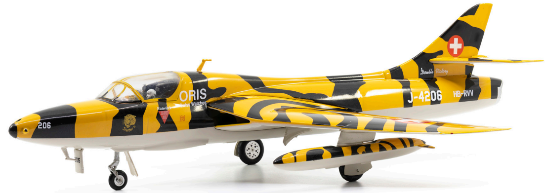
Hawker Hunter T.Mk.68 J-4206 HB-RVV «Tiger Look»