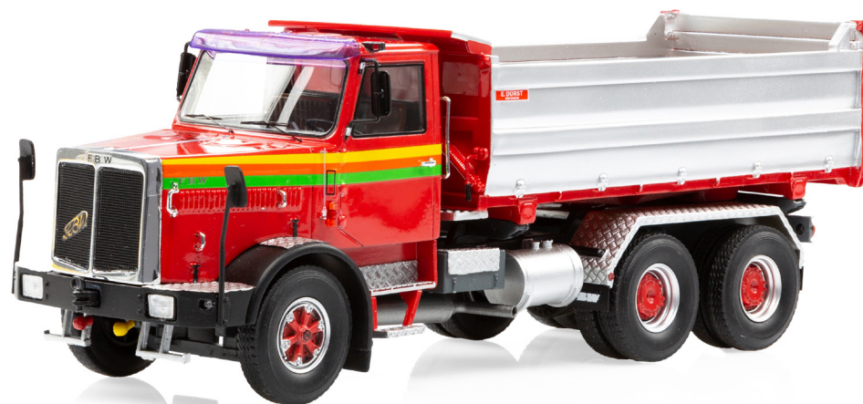
FBW 80N E6A 6x2 Kipper