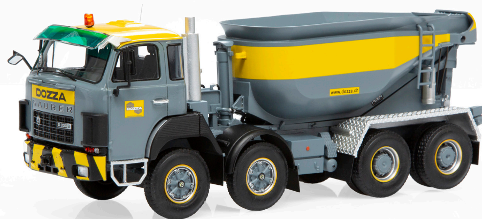
Saurer D330B F8x4 Betonmulde