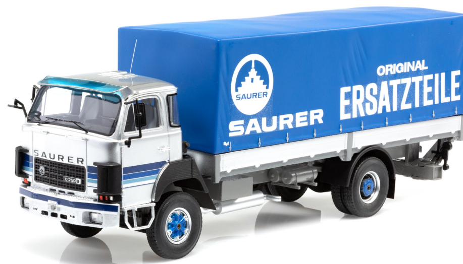
Saurer D250B F4x4 Pritsche-Plane