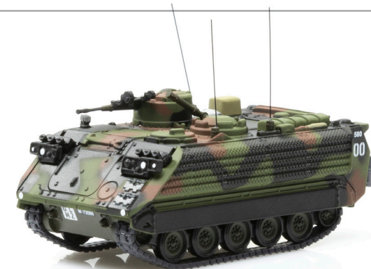
M113 Kommandopanzer 63/89 KAWEST