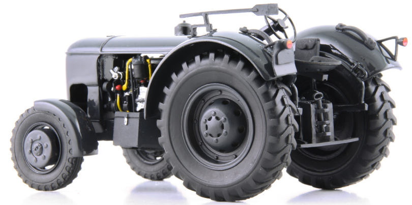
Vevey 560 Armeetraktor 4x2 (1948)