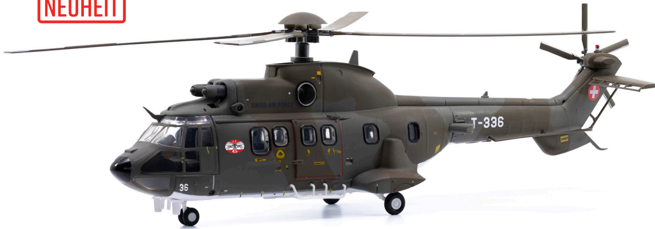
Cougar AS532 T-336 LT-Staffel 6