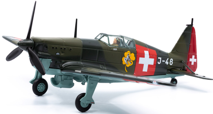
Morane D-3800 J-48 «Hexe» (1940)