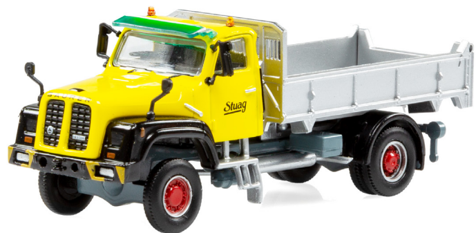
Saurer D330B N4x4 Kipper