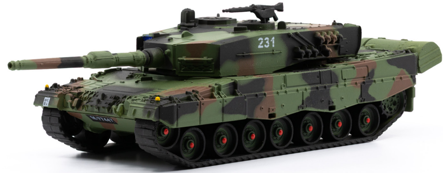
Pz 87 Leopard WE mit Schalldämpfer K-Nr. 231