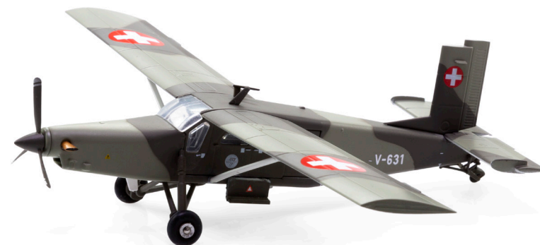
Pilatus PC-6 Turbo Porter V-631