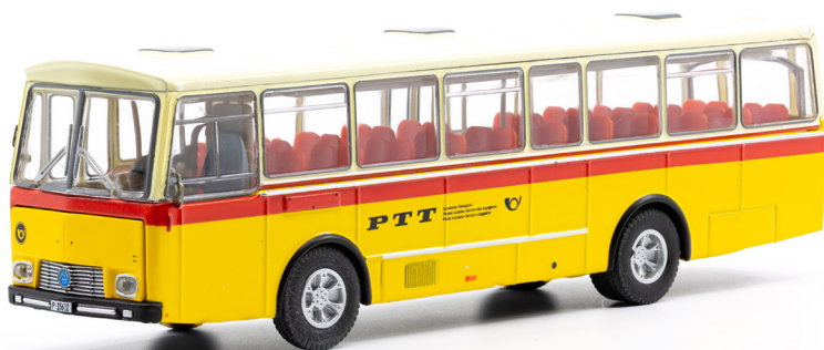
Saurer 3DUK Reisebus