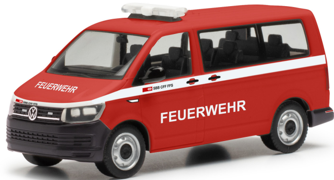
VW T6 Transporter