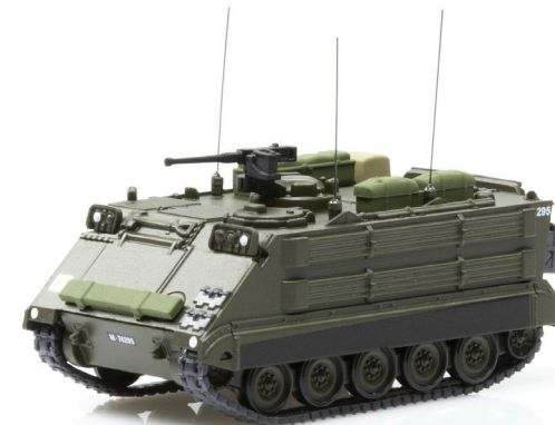
M113 Übermittlungspanzer 63