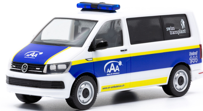
VW T6 Transporter