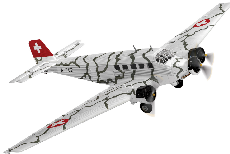
Junkers Ju 52/3 A-702 Tarnmuster

Dazu hatte man das Flugzeug mit einem Tarnmuster versehen, das nach Beendigung der Dreharbeiten weiterhin so belassen wurde. So war das Flugzeug noch weitere 14 Jahre in der Schweizer Armee im Einsatz. Die zivile Farbgebung erfolgte erst im Jahr 1982 als die Maschine an die Ju-Air übergeben und mit der Immatriculation HB-HOT versehen wurde.