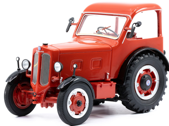
Hürlimann D-500 Industrietraktor