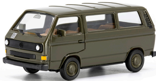
VW T3 Militärtransporter