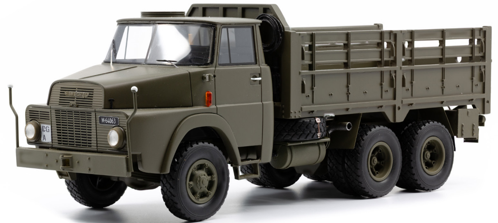
Henschel HS 3-14 HA CH 8,2 t gl 6x6