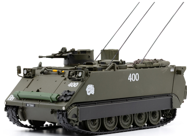
M113 Kommandopanzer 73