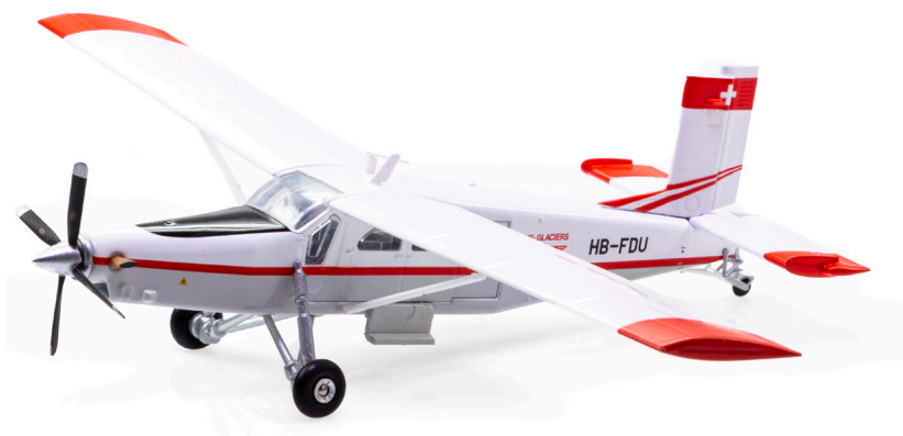
Pilatus PC-6 Turbo Porter HB-FDU

Der wirkliche Durchbruch gelang 1959 mit dem Pilatus Porter PC-6. Dieses Mehrzweckflugzeug bestach durch seine ausserordentliche Robustheit und seine STOL-Eigenschaften (Short Take Off & Landing), seine Fähigkeit auf ganz kurzen Pisten zu starten und zu landen. Rasch wuchs der Absatz auf dem internationalen Flugzeugmarkt – die Nachfrage nach dem PC-6 hält bis zum heutigen Tag an.