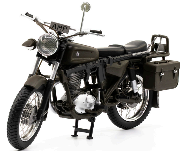
Condor A 350 (1972)