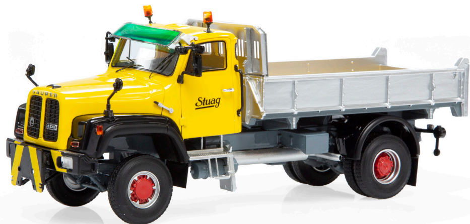
Saurer D330B N4x4 Kipper