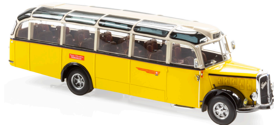
Saurer L4C-Alpenwagen IIIa

Anfang der 50er-Jahre wollten die PTT weg vom bisherigen Car alpin mit Stoffschiebedach: aufwändig im Unterhalt, Durchzug bei offenem Dach und schlechte Heizresultate im Winter. Josef Hausner, Ingenieur der Automobilabteilung PTT fand die Lösung in Form des sog. «Glaswagens». Heckfensterbereich und Dachrand wurden mit rauchfarbigem Plexiglas transparent gehalten für den freien Blick in die Bergwelt. In der Dachmitte verlief ein Luftkanal, der über Staudruck oder Gebläse Frischluft in den Passagierraum fließen liess. Kein anderes Fahrzeug der sogenannten Schnauzen-Postautos verfügte über mehr Komfort, Rundumsicht und eine derart schöne Linienführung.