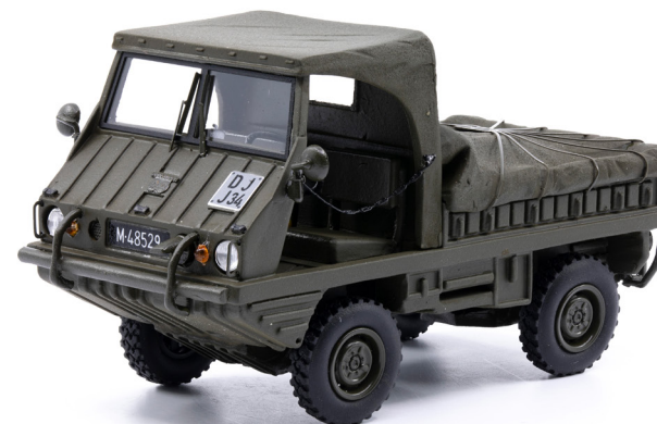
Steyr-Puch Typ 700 AP Haflinger mit Plane auf Ladefläche