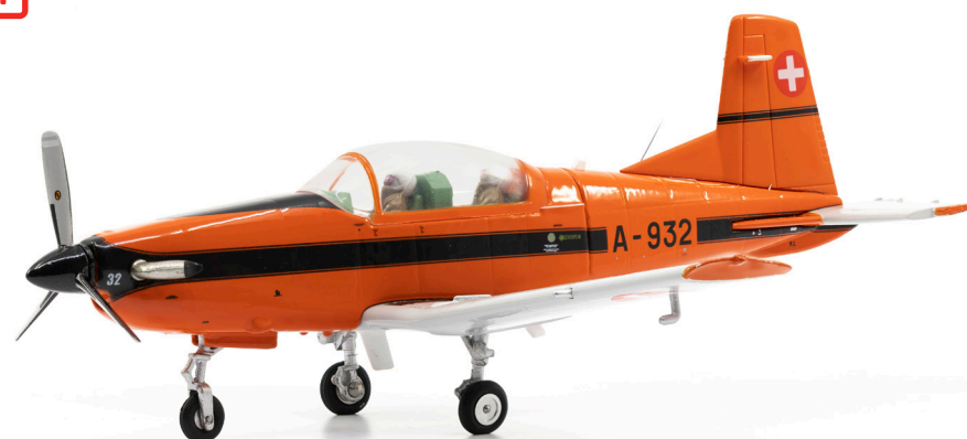
Pilatus PC-7 A-932 Ursprungsbemalung orange