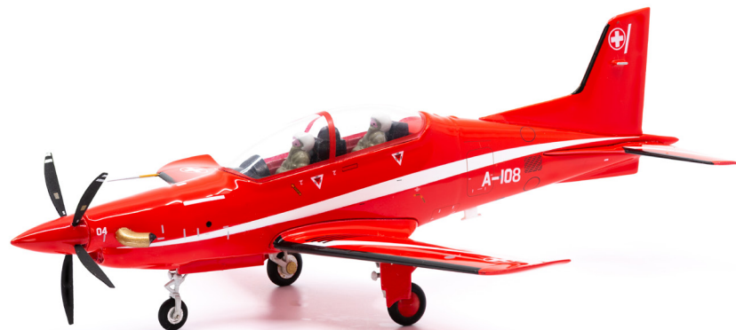
Pilatus PC-21 A-108