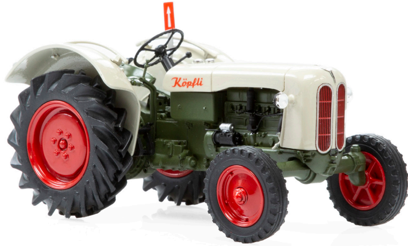
Köpfler Trumpf (1955)