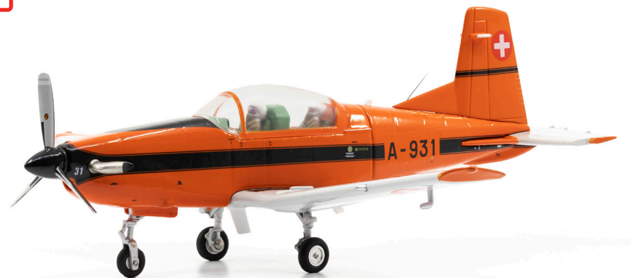
Pilatus PC-7 A-931 Ursprungsbemalung orange