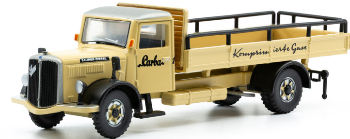
Saurer S4C Pritsche mit eckigen Fenstern (1956)