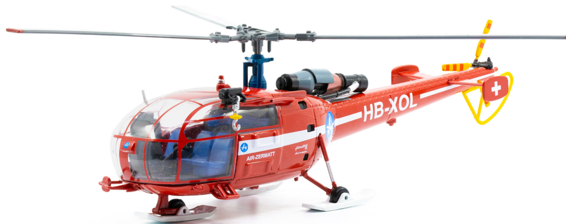
Alouette III HB-XOL