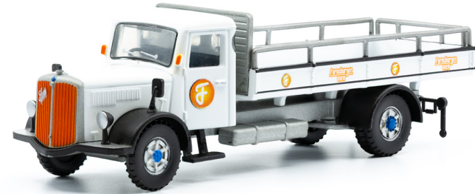
Saurer S4C Pritsche mit runden Fenstern (1963)