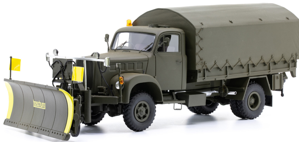
Saurer 2DM mit Räumschild Boschung