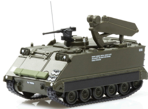
M113 Kranpanzer 63

Zusatzteile für Ladekran offen und geschlossen