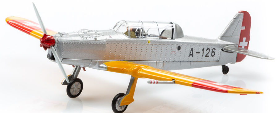
Pilatus P-2-05 A-126 (1949)