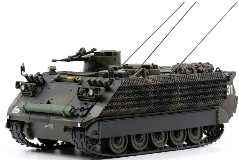
M113 Schützenpanzer 89