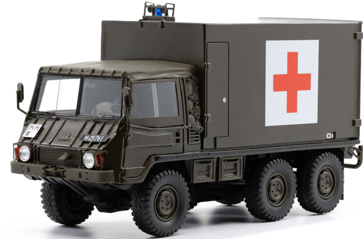
Steyr-Puch Pinzgauer 712 T 6x6 Sanw 4gl Sanität