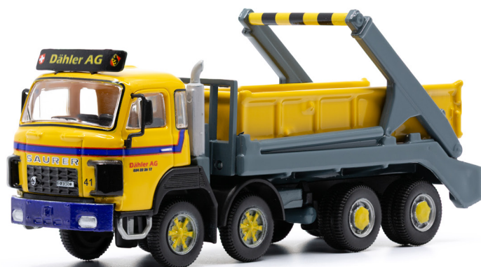
Saurer D330B F8x4 Welaki