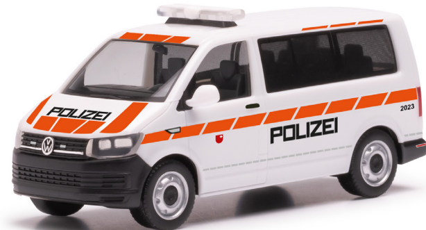
85.005116 VW T6 Transporter Kantonspolizei Schwyz