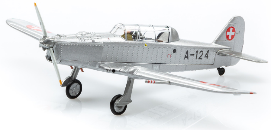
Pilatus P-2-05 A-124 (1963)

Die Entwicklung des ersten Pilatus P-2 Prototypen geht auf das Jahr 1943 zurück und wurde mit einem erfolgreichen Erstflug am 27. April 1945 gekrönt. Die Bezeichnung dieses Moders war erwartungsgemäss P-2-01. In der Folge entstanden Änderungen und Verbesserungen die sich über den gesamten Produktionszeitraum bis hin zum Typ P-2-06 hinzogen. Bei der Wahl unseres Modells haben wir uns für die Varianten aus den Jahren 1947 und 1948 entschieden. Baulich gut erkennbar an den Unterschieden bei der Propellerspitze und der Lufthutze vor dem Cockpit. Und selbstverständlich auch an der Bemalungsvariante.