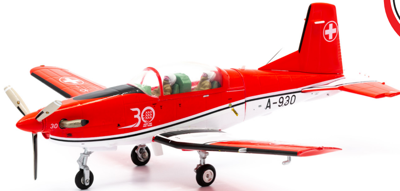
Pilatus PC-7 A-930 PC-7 TEAM Jubiläumsversion 30-Jahre