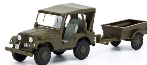
Willys Jeep M38A1 mit Aebi Gelpw Anh 68

Der Erfolg den wir mit den Ikonen unter den Schweizer Raupenfahrzeugen erzielten, hat uns bestärkt auf diesem Feld noch weiter aktiv zu werden. So haben wir mittlerweile über die verschiedenen Epochen hinweg, aus jedem Jahrzehnt die wichtigsten Panzer in unserem Sortiment. Dieses Jahr konnten wir die noch bestehende Lücke mit zeitgenössischen Fahrzeugen schliessen und lancieren den Pz 87 Leopard mit und ohne den markanten Schalldämpfer am Heck, sowie den aktuellen Schützenpanzer 2000 Högglunds in Gefechts- und Kommandoversion.