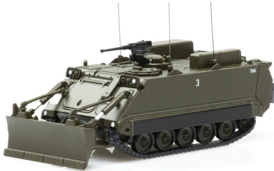
M113 Geniepanzer 63