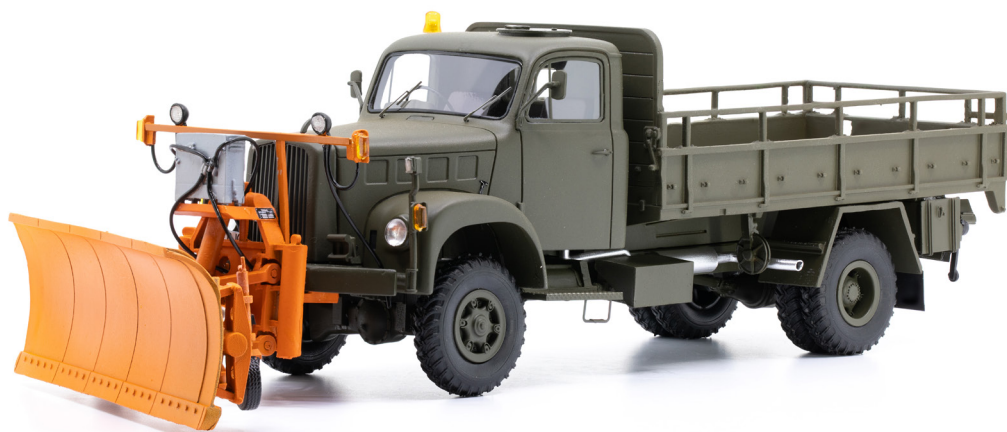
Berna 2VM mit Räumschild orange