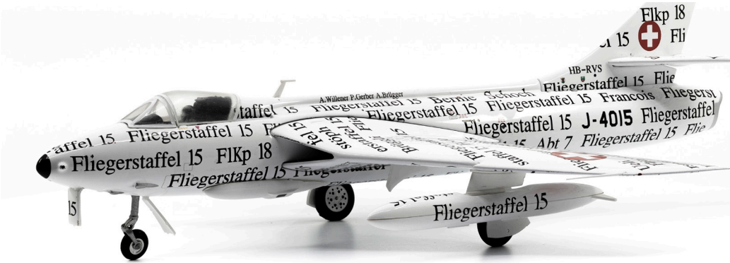
Hawker Hunter Mk.58 J-4015 «Papyrus»