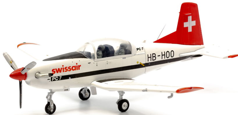
Pilatus PC-7 Swissair HB-H00