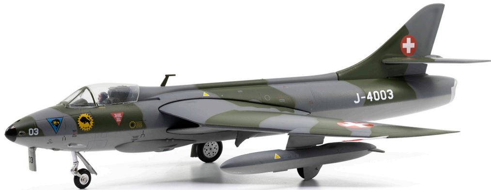
Hawker Hunter Mk.58 J-4003