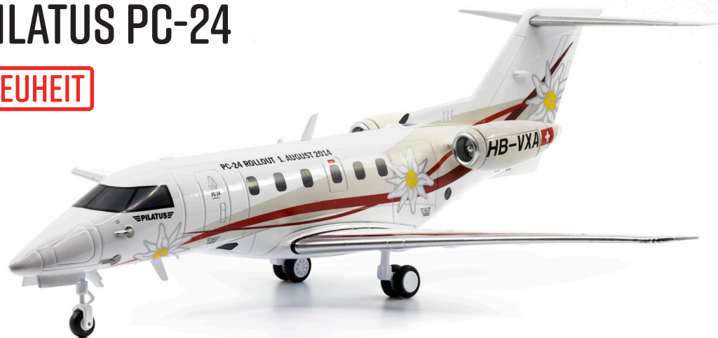
Pilatus PC-24 HB-VXA Rollout-Version