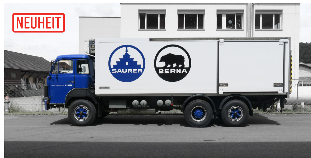
Saurer D290B F6x2 Frigo