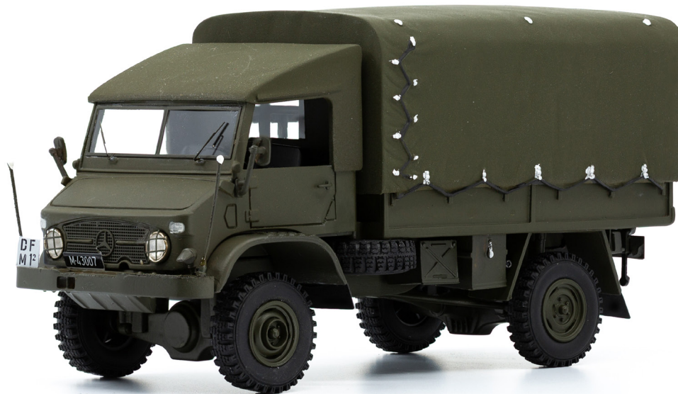
MB Unimog S 404 mit L Flab 54