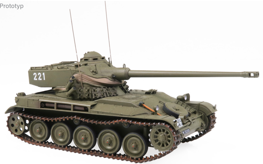
L Pz 51 AMX-13 K-Nr. 221