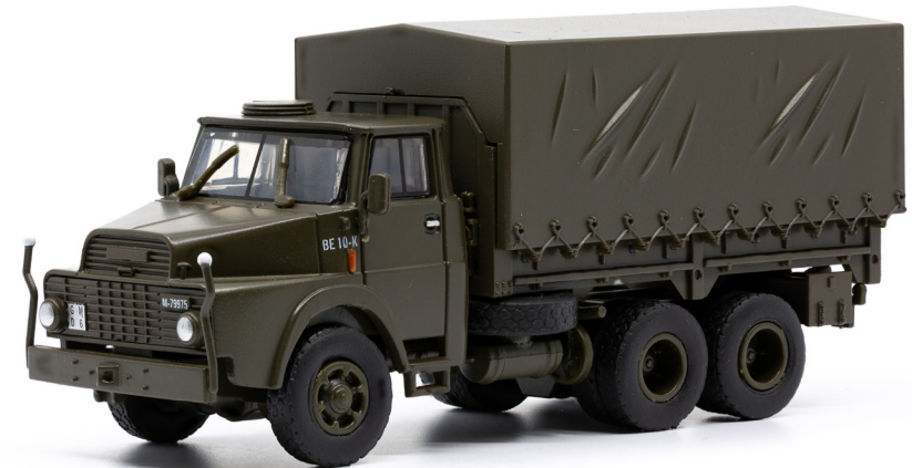
Henschel HS 3-14 HA CH 8,2 t gl 6x6 Plane geschlossen

Die Typen mit offener Ladebrücke führten i. d. R. Grossteile. Diejenigen mit geschlossener Plane wiesen auf der Ladebrücke ein Kanistergestell auf, das mit 20-Liter Treibstoffkanister bestückt wurde. Die Version mit Rotzler Laded Kran – mit fast 9 m langen Auslage – stand der Truppe für den Munitionsumschlag bereit. Der äusserst zuverlässige Henschel stand bei den Truppen bis ins Jahr 2004 im Einsatz.