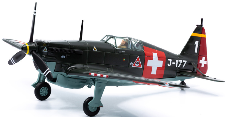
Morane D-3801 J-177 «Bulldog» (1944)