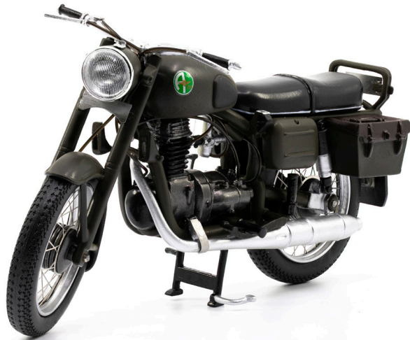
Condor A 250 (1959)

Der gute Ruf von Condor festigte sich umso mehr, als in den darauffolgenden Jahren erste motorisierte Armeemaschinen gebaut wurden. In der Nachkriegszeit erlebte die Firma ihre absolute Blütezeit: Von der berühmten A 580 wurden 2850 Exemplare an die Schweizer Armee geliefert. Von der A 350 sogar deren 3000!