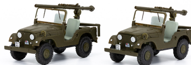
Set mit zwei Willys Jeep M38A1 PAK 58 Panzer-Abwehr Kompanie BAT