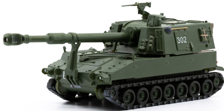
Panzerhaubitze M-109 Jg 74 Langrohr K-Nr. 302