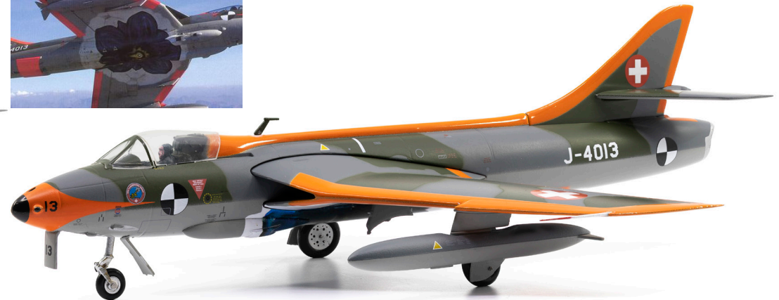
Hawker Hunter Mk.58 J-4013 GRD-Ausführung