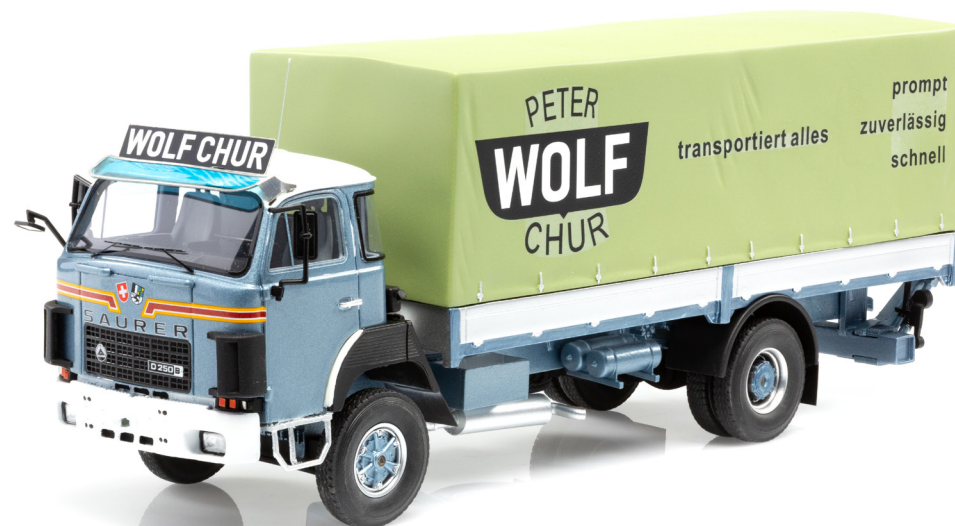
Saurer D250B F4x4 Pritsche-Plane