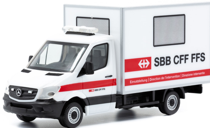
MB Sprinter 516 Cdi 4x4 SBB Einsatzleitung