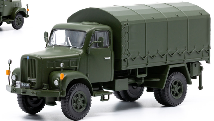
Saurer 2DM 4x4 Plane geschlossen