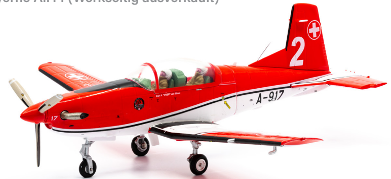
Pilatus PC-7 A-917 PC-7 TEAM Nr. 2