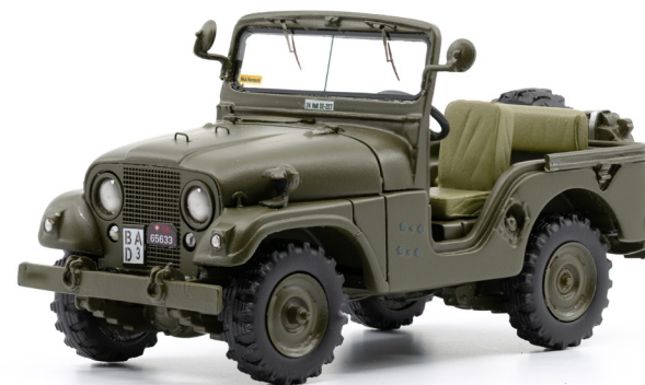
Willys Jeep M38A1 offen

So bilden sich nach und nach Sammler-Szenen wie z.B. diejenigen von Traktormodellen oder Freunde von Militärfahrzeugen, die bereit sind einen höheren Preis zu entrichten, dafür aber Resin-Guss Replikas von Schweizer Fahrzeugen besitzen die auf dem internationalen Markt keine Chance hätten produziert zu werden.