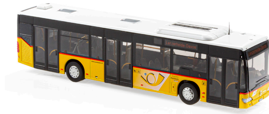
MB Citaro O530NL Lenzerheide-Davos