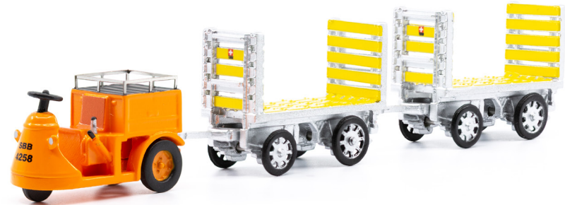
NEFAG Elektro-Schlepper 3-Rad mit zwei Anhänger