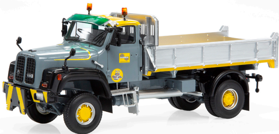
Saurer D330B N4x4 Kipper