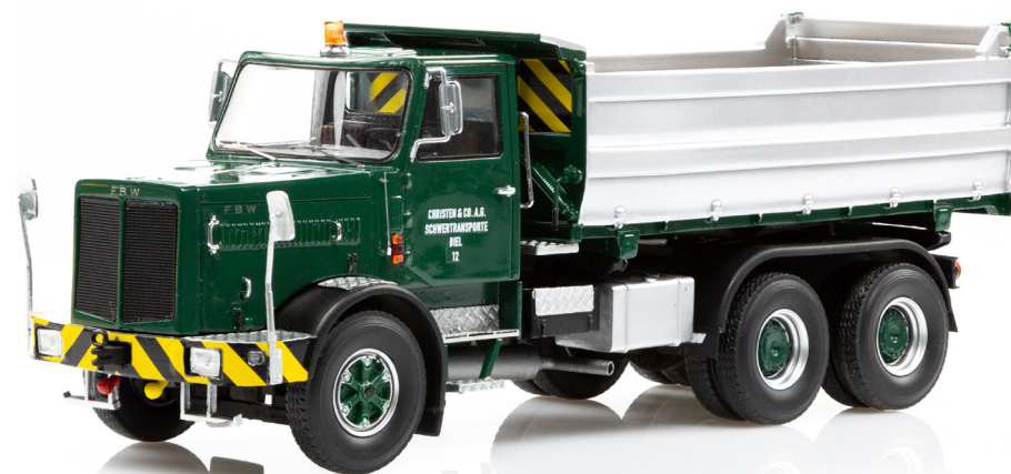
FBW 80N E6A 6x2 Kipper